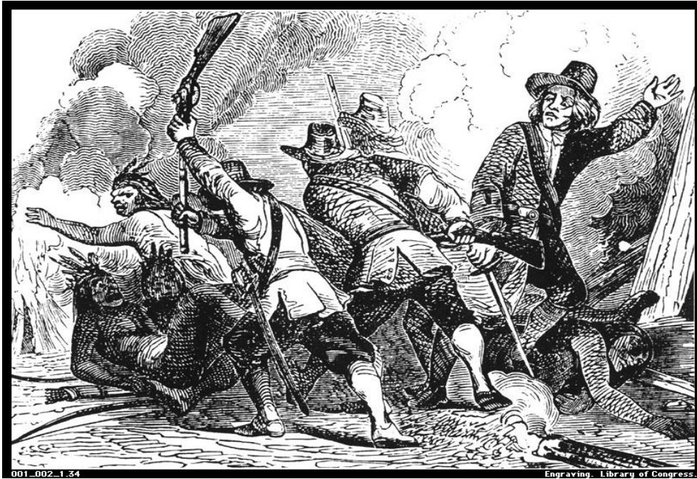
Slika 2. - Jednostavan prikaz jednog od sukoba puritanaca i članova domorodačkog plemena Pequota u Pequotskom ratu 1637. godine ( https://en.wikipedia.org/wiki/Pequot_War )