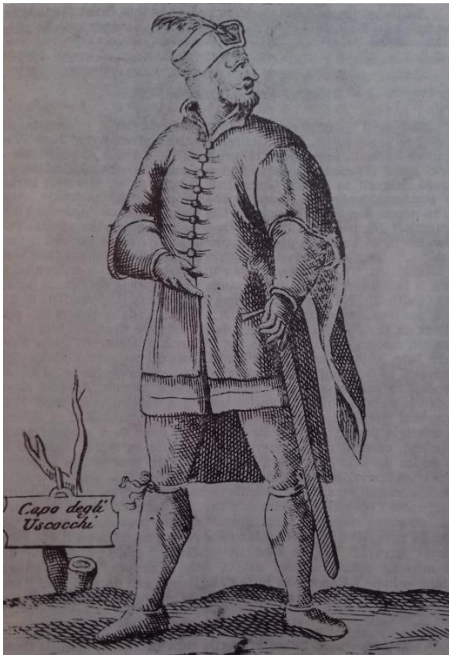
Uskočki vođa (vojvoda), bakrorez, 17. st.