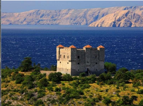
Nehaj, uskočka tvrđava kod Senja