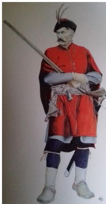
Uskok iz Senja