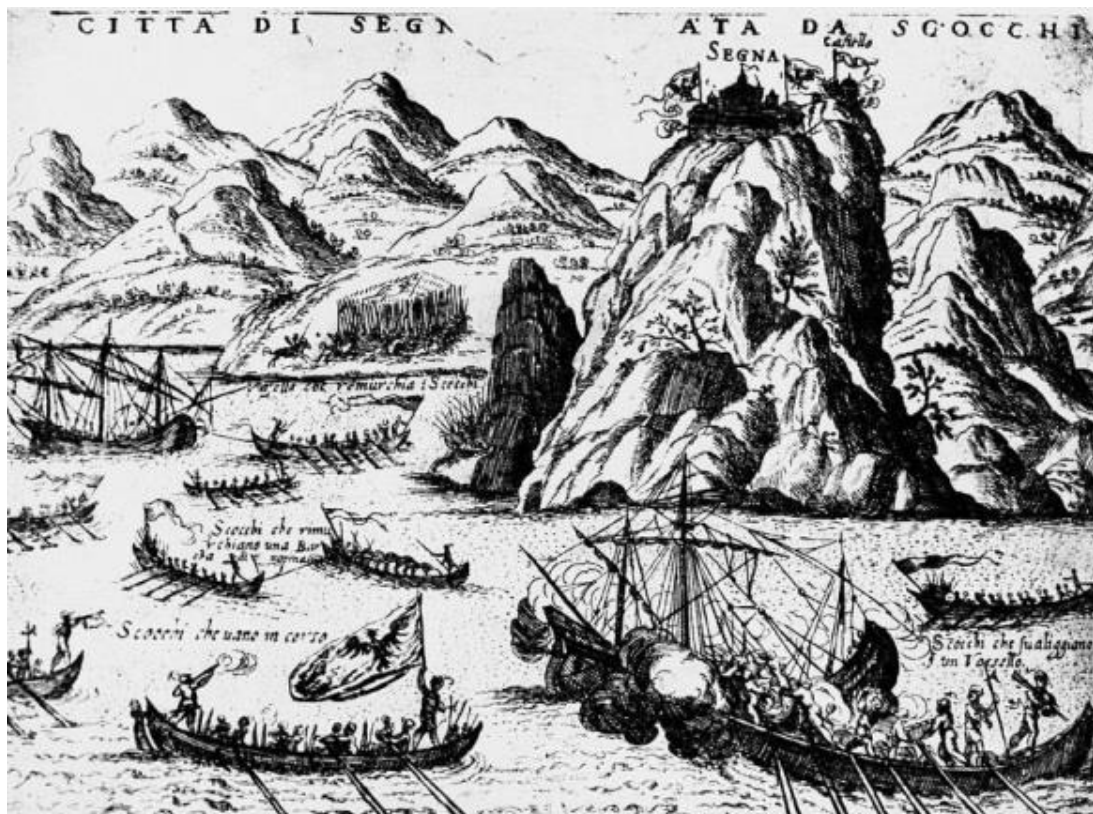
Uskoci napadaju Mlečane ispred grada Senja, XVI. st., iz Vatikanske knjižnice