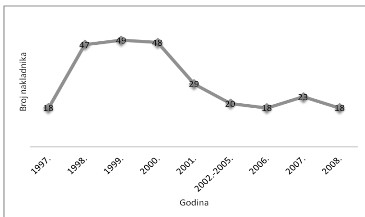
Grafikon 1. Broj nakladnika knjiga za djecu i mladež u Hrvatskoj 1997. – 2008.

Za razdoblje od 1982. do 1997. godine nema zabilježenih podataka o nakladništvu slikovnica.