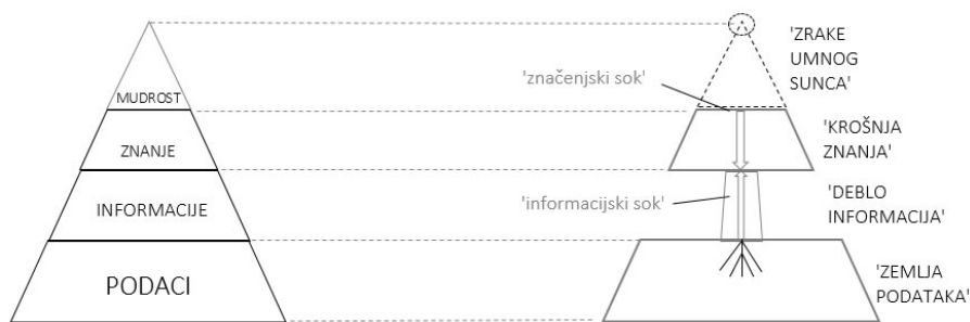
Slika 2. Modifikacija DIKW-hijerarhije: iz piramide u 'stablo znanja'

Na simboličkoj slici 'stabla znanja' informacija se u obliku soka prepoznaje kao jedan od ključnih supstrata koji omogućuju njegov rast. 'Zemlja podataka' na kojoj 'stablo znanja' izrasta predstavlja simbol dohvatljivoga, mjerljivog 'vanjskog svijeta', dok njegova krošnja simbolizira čovjekovo eksplicitno znanje o tom 'vanjskom svijetu'. Daljnjom analogijom deblo stabla može simbolizirati komunikacijski kanal kojim se prenose informacije, dok njegovo korijenje može predstavljati simbole mjernih instrumenata za dohvaćanje podataka iz 'vanjskog svijeta' itd.