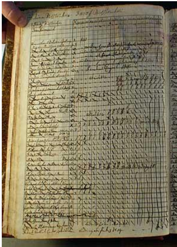
Slika 1. Primjer jedne stranice u Status animarumu 43

Status animarum, običnim rječnikom pojašnjeno, crkvena je knjiga iz koje je moguće iščitati rodbinske odnose unutar jedne obitelji tijekom više generacija.