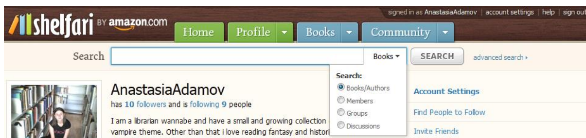
Slika 20. Shelfari vizualni identitet 101

"Literatura je luksuz; fikcija je potreba.." ~ G.K. Chesterton 102