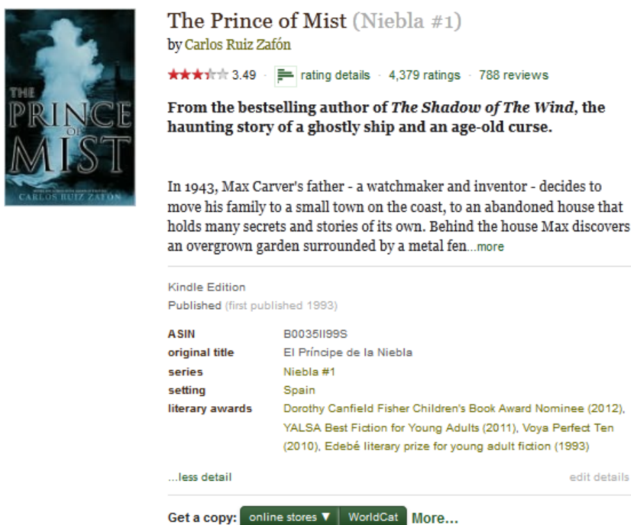
Slika 19. Izgled zapisa knjige Goodreads 99

Nudi se i program za autore, te pomoć za nove autore i nekoliko načina promocije autorskih izdanja. Svaki čitatelj može dodati neku novu knjigu ukoliko ona već ne postoji ili dodati naslovnicu izdanja koje on posjeduje, ali sve promjene evaluiraju mrežni knjižničari koji djeluju u sklopu zajednice.