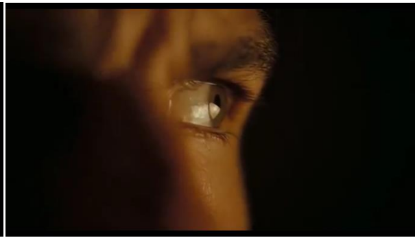
Abb.18: Stauffenbergs Auge – während er seine Verbitterung in einem Brief festhält Singer (2:41)