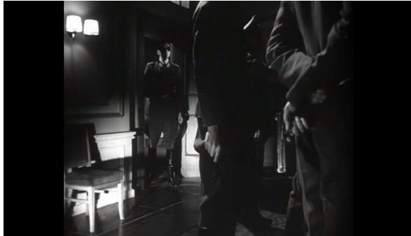
Abb.21: Stauffenberg lauscht der Besprechung von Fromms Leuten nach, Pabst (1:05:58)