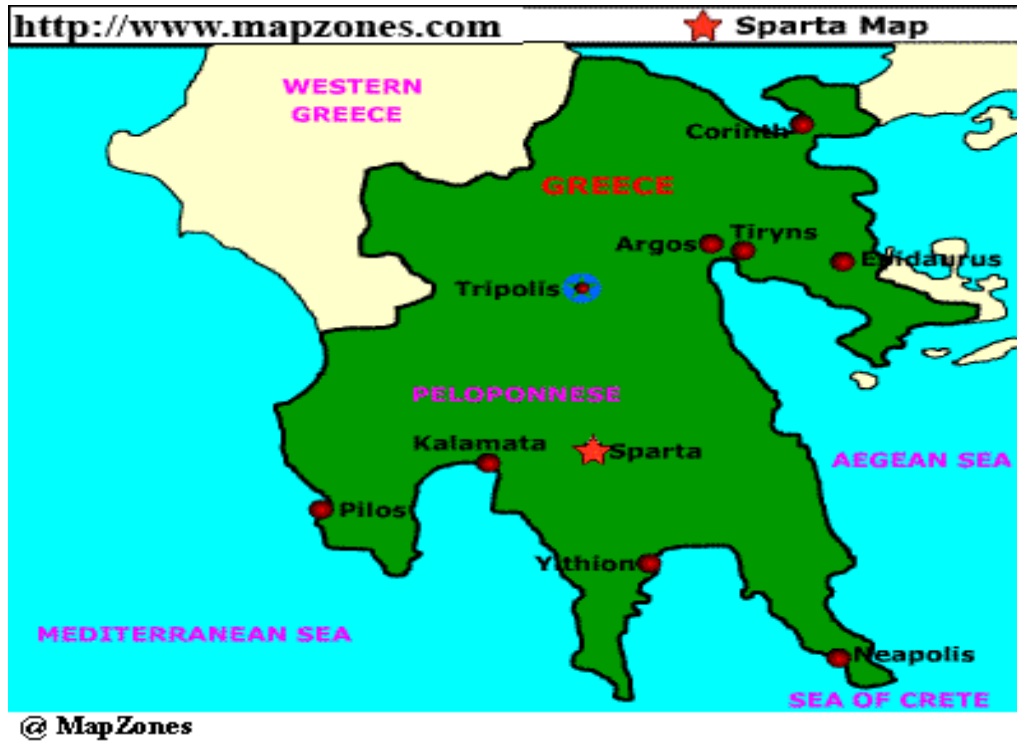
Prilog 1 – Položaj Sparte na karti Peloponeza