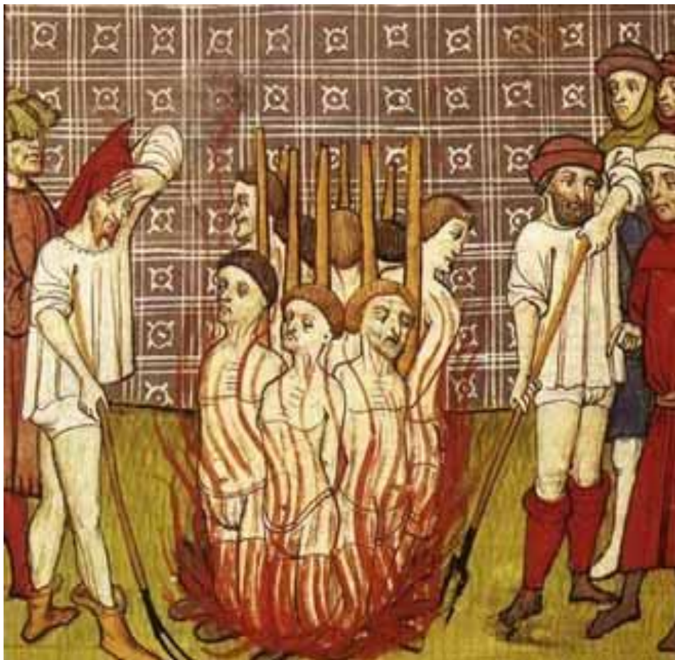
Mučenje i spaljivanje heretika