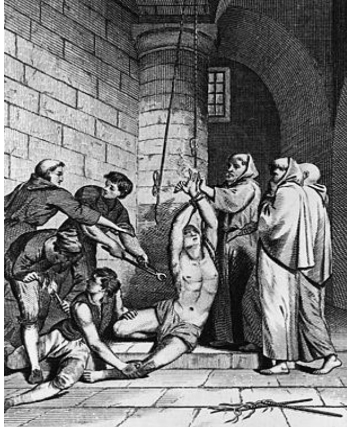
Postupak mučenja rastezanjem tijela uz pomoć ljestvi