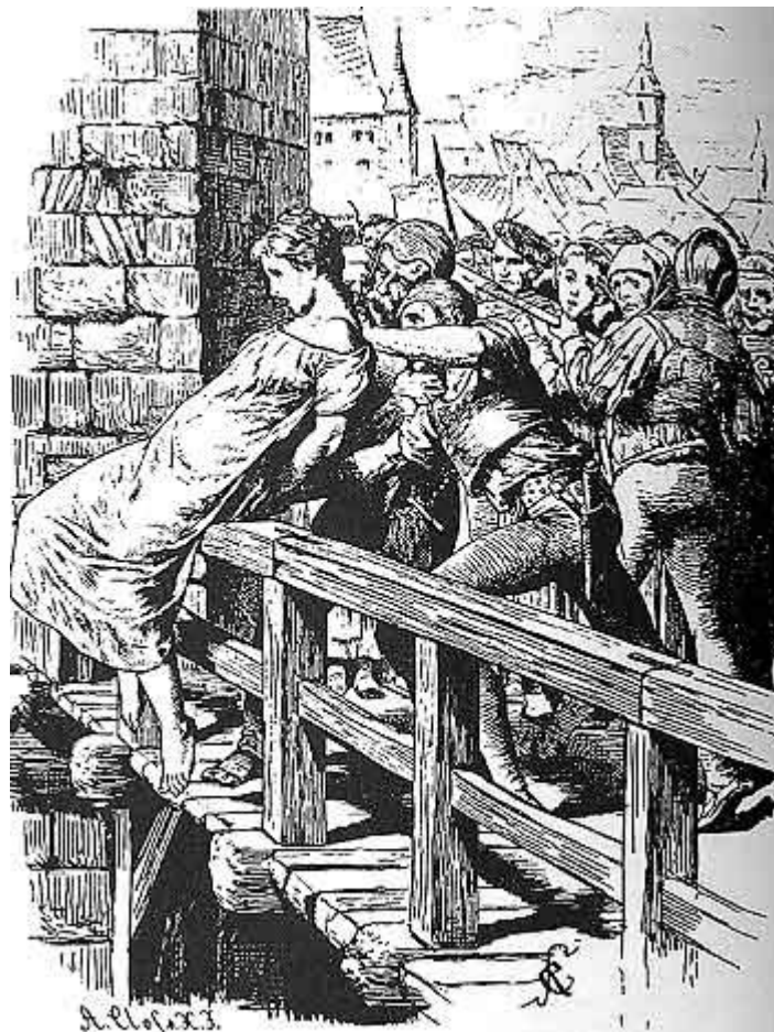
Sud hladne vode – vještica se bacala u rijeku kako bi se ustvrdilo posjeduje li moći