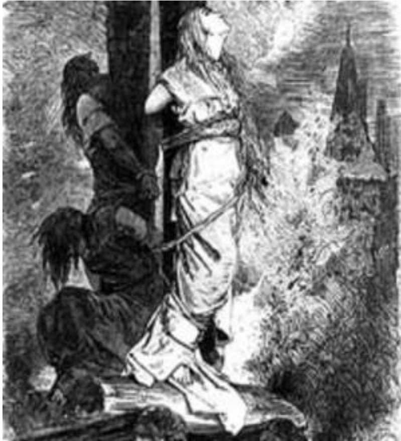
Spaljivanje vještica na lomači