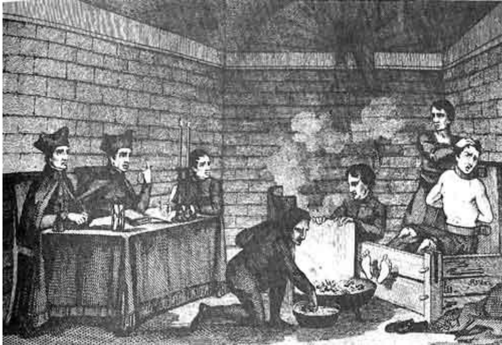
Mučenje vatrom i usijanim željezom