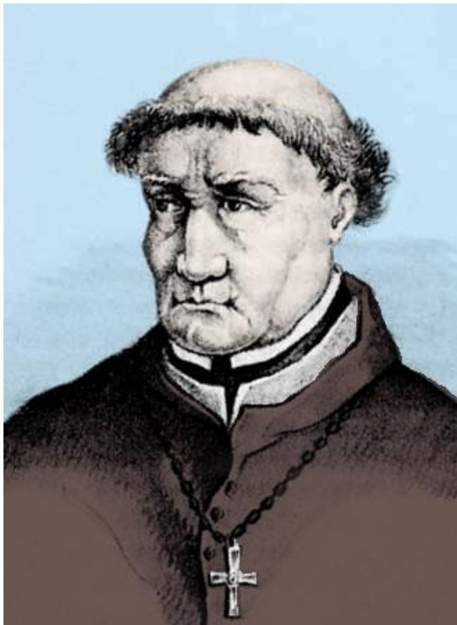
Tomas de Torquemada – prvi veliki španjolski inkvizitor