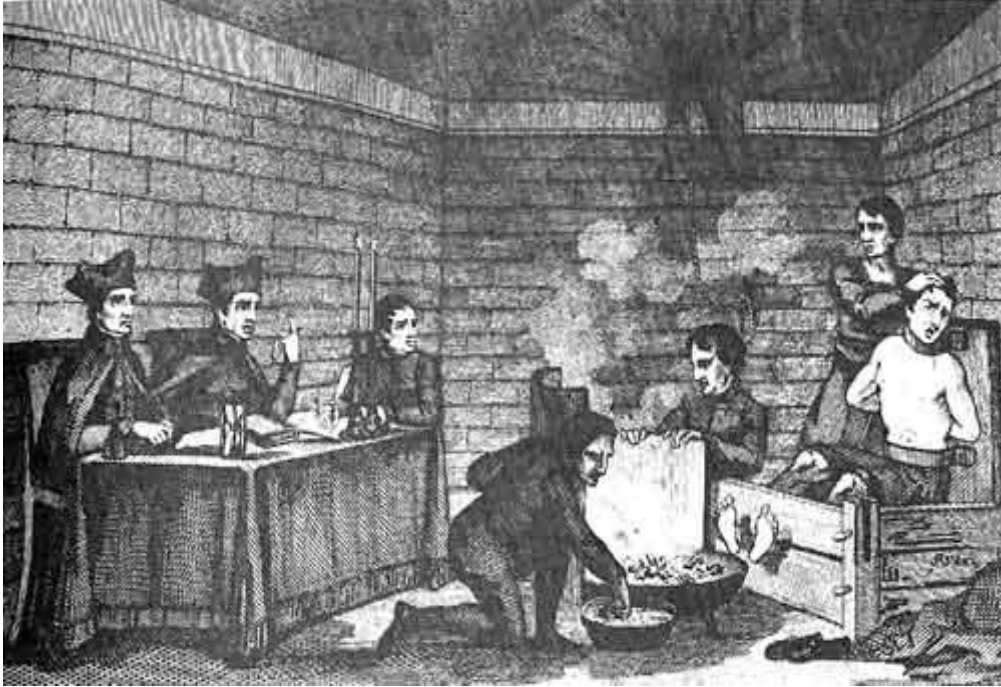
Mučenje vatrom i usijanim željezom