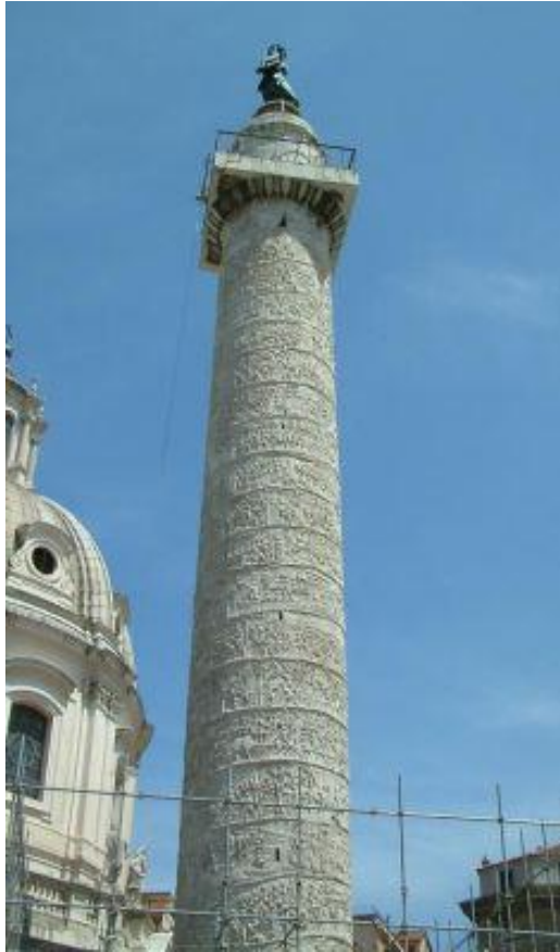
Slika 3: Trajanov stup