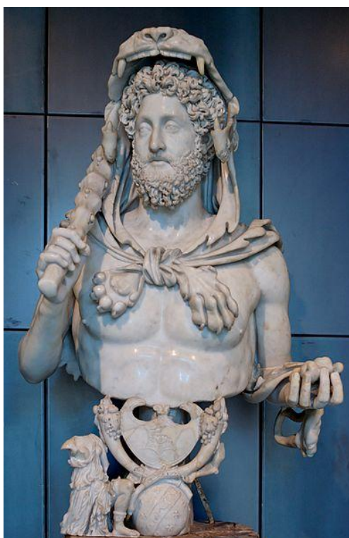
Slika 8: Bista Komoda prikazanog kao Heraklo