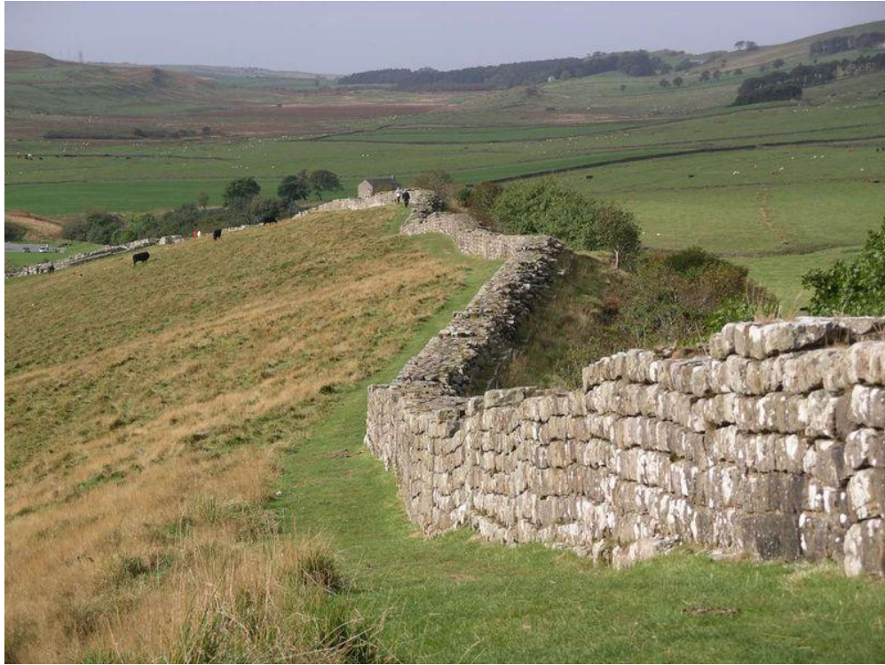
Slika 5: Dio Hadrijanova zida