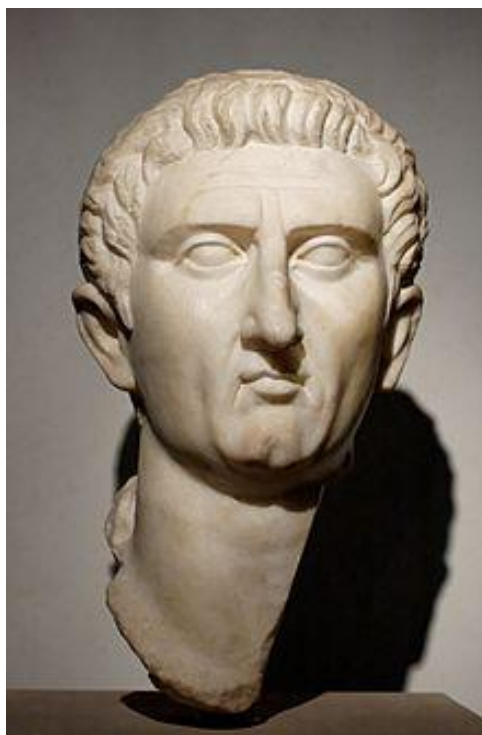
Slika 1: Bista Nerve