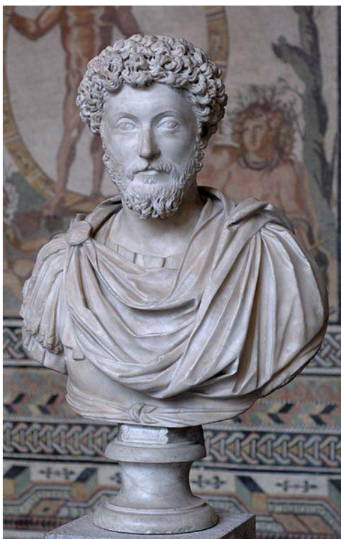
Slika 7: Bista Marka Aurelija