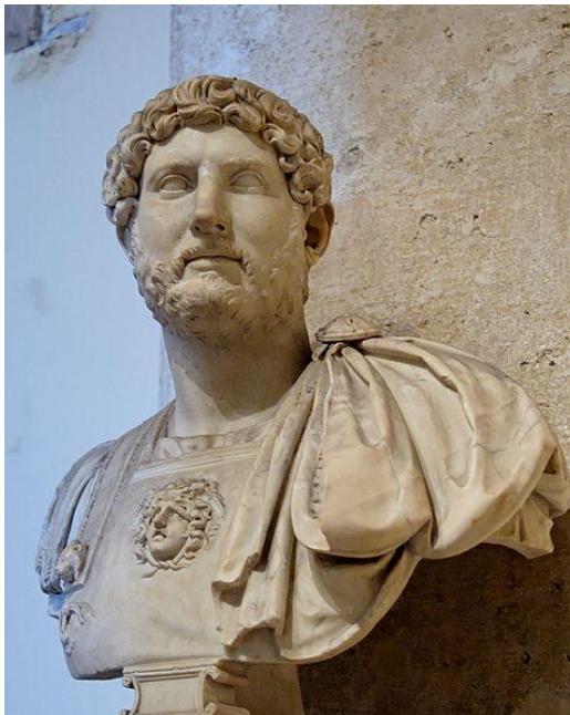
Slika 4: Bista Hadrijana