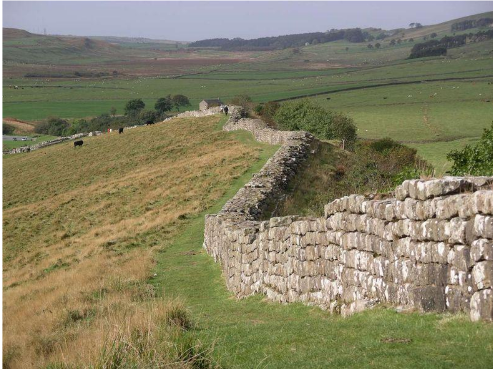
Slika 5: Dio Hadrijanova zida