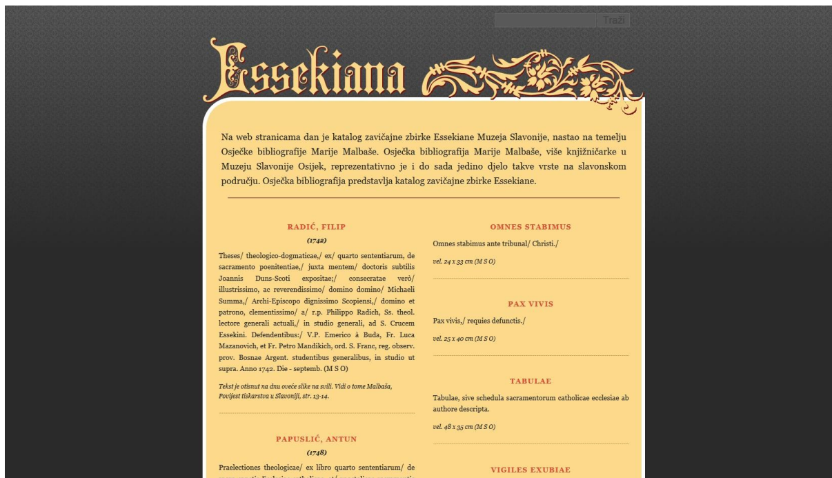
Prilog 2: Izgled početne stranice mrežnog kataloga zavičajne zbirke Essekiana na internet stranici Muzeja Slavonije Osijek - http://www.mso.hr/essekiana/