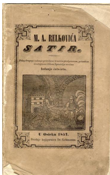
Prilog 3: Primjer digitalizirane naslovne stranice tiskovine iz zavičajne zbirke Essekiana