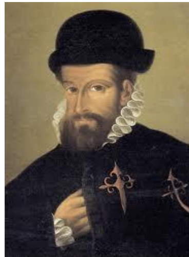
Slika 16. Francisco Pizarro