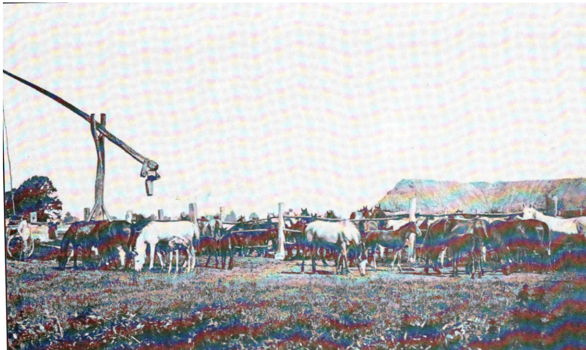
Slika 2 Ergela u budrovačkom lugu

Godine 1881. vlastelinska ergela brojala je 87 konja, a 1885. već je u ergeli bilo 104 grla. 1900. godine vlastelinstvo je brojalo 119 konja u gospodarstvu, a s onima u ergeli, odraslih i ždrjebadi, 288 grla. 39