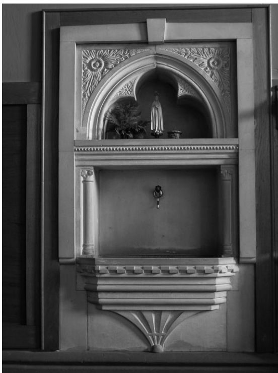
Slika 7 Česma u sakristiji đakovačke katedrale, izvedena vjerojatno po Bolléovim projektima

Prvi uopće sačuvani projekt koji je Bollé sam potpisao bio je za ogradu od kovanoga željeza za stubište uz lijevu sakristiju. Završio ga je krajem siječnja 1878. godine, a ubrzo je potom sastavio i proračun za izradu ograde kod bečkoga bravara Reibela. Nesumnjivo je da je izrađivao dosta samostalno izvedbene projekte za orgulje, a čini se da je napravio i projekt za škropionicu.