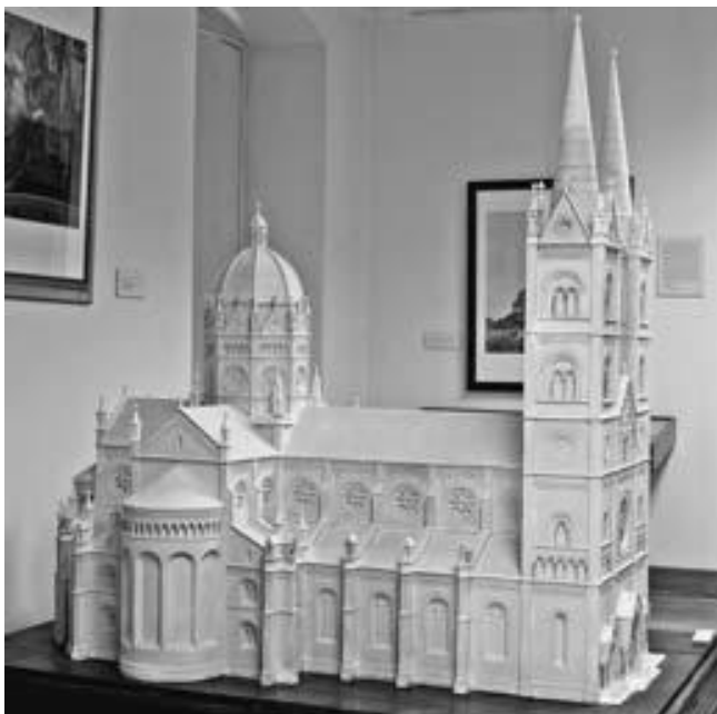
Slika 4 Maketa đakovačke katedrale 1866. (izgrađena prema trećem Rösnerovom projektu)

Po Rösnerovom projektu iz 1865. godine, a i po kasnijim djelomično modificiranim Schmidtovim izvedbenim nacrtima, stvoren je dojam da je katedrala sagrađena u prijelaznom romaničko-gotičkom stilu. Katkad se tvrdilo da je sam Strossmayer uvjetovao primjenu ovoga stila, ali čini se da se ipak radilo o slučajnoj posljedici odabira sjevernotalijanske romanike kao glavnoga uzora.