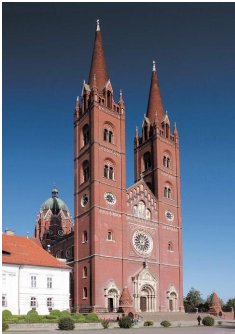
Slika 3 Đakovačka katedrala

Stolna crkva Đakovačke i srijemske biskupije koju Josip Juraj Strossmayer gradio od 1866. do 1882. godine, zadnja je katedrala izgrađena na prostoru prema Istoku zemlje. Veličanstven i topao romanski stil osmislio je najpoznatiji romantičar toga vremena Karlo Rösner iz Beča, a poslije njegove smrti djelo nastavlja Friedrich Schmidt, obogaćujući ga gotskom arhitektonskom ornamentikom. Osobita vrijednost katedrale su, uz monumentalnu arhitekturu, 43 freske na velikim zidnim ploham glavne i poprečne lađe. Sve osim dvije, koje je uradio Ljudevit Ansiglioni, naslikali su njemački slikari – otac i sin Aleksandar-Maksimilijan i Ljudevit Seitz. Katedrala je obogaćena sa sedam oltara i 31 kamenim kipom koje su klesali Vatroslav Donegani, Tomo Vodička i Georg Feuerstein. Raskoš crkvi daju bogati i raznovrsni ornamenti na ploham, svodovima i stupovima koje je radio Josip Voltolini te namještaj i rezbarije Ivana Tordinca, Dragutina Turkovića i Tome Vodičke. U katedrali se nalaze i 32 reljefa, među kojima je i reljef u bijelom mramoru na grobu velikoga biskupa graditelja đakovačkoga hrama vjere, rad kipara Rudolfa Valdeca. Svečanost njezine unutrašnjosti zaokružuju pozlaćeni lusteri i veličanstvene orgulje. 40