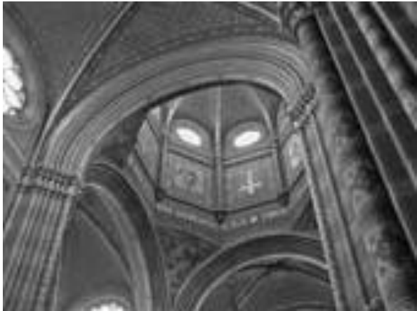
Slika 5 Unutrašnjost kupole đakovačke katedrale

Rösnerova kupola sa svojom visinom od 59 metara spada u najveće i najznačajnije kupole historicizma Austro-Ugarske. U graditeljstvo Monarhije njome je unesen motiv visoke križaste kupole, koji će se poslije često koristiti. 41