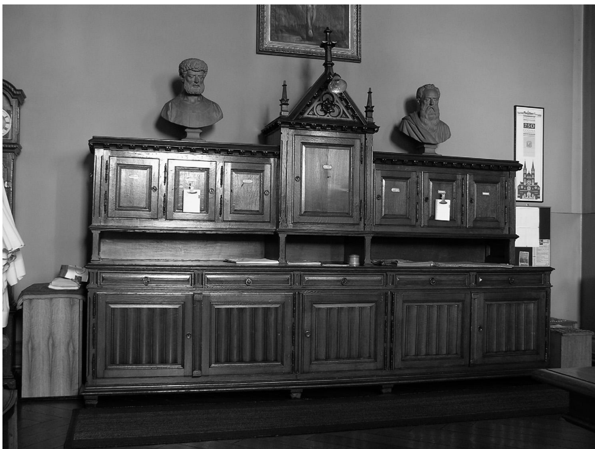
Slika 8 Ormar u sakristiji đakovačke katedrale izveli su po Bolléovu projektu đakovački stolari Ivan Tordinac i Dragutin Turković, 1882. godine

Napravio je i namještaj za katedralu. Svi dijelovi namještaja koje je Bollé samostalno projektirao i u prostoru katedrale i u pomoćnim prostorijama te građevine (stubište, sakristija) oblikovno su bliži gotičkome nego romaničkome stilu, u kojem je podignuta đakovačka katedrala, čime se Bollé u osnovi nadovezao na rješenja svojega učitelja Friedricha Schmidta. 43