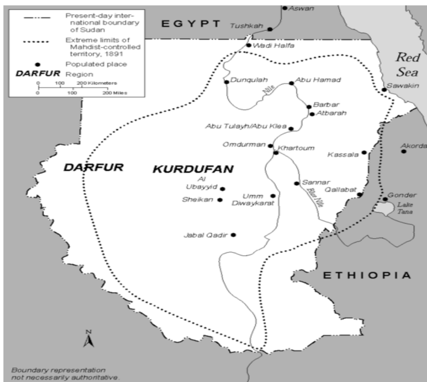
Granice Sudana 1891. godine, nakon uspostave Mahdijske države, i danas