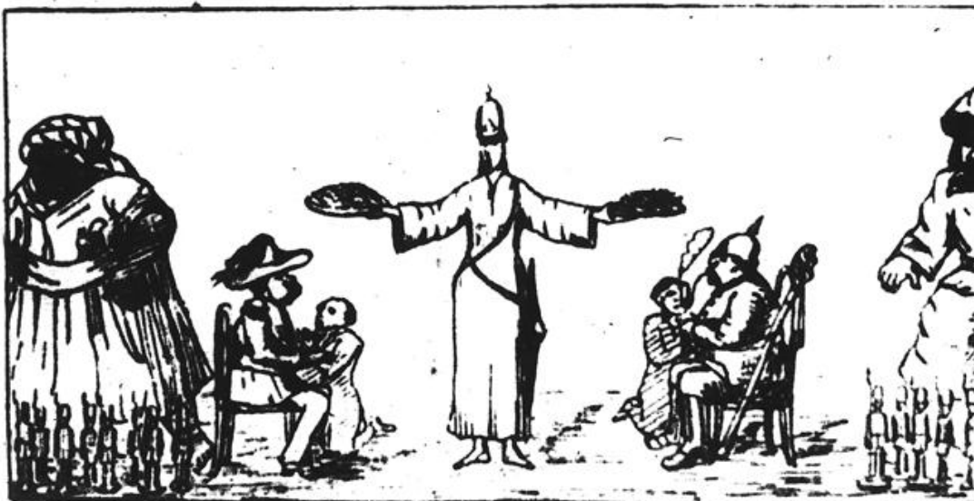
Karikatura Mahdija iz kasnijeg razdoblja, 1885