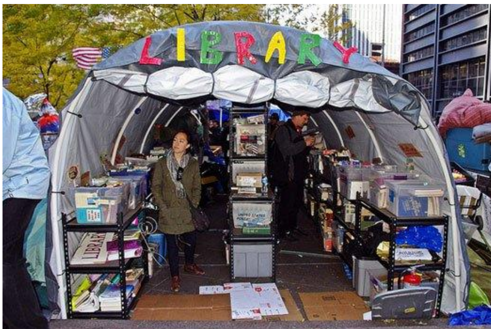
Slika 5. Knjižnica u Zuccotti Parku u New Yorku

U Argentini je narodna knjižnica izmjestila dio svoje knjižnične građe izvan svoga prostora, koristeći u tu svrhu demobilizirani vojni tenk iz 1970-e (slika 6). Motivacija za ovaj gerila projekt proizašla je kao odgovor na postojeći lokalni sustav. 37