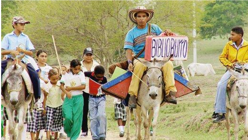
Slika 10. Pokretna knjižnica u Kolumbiji