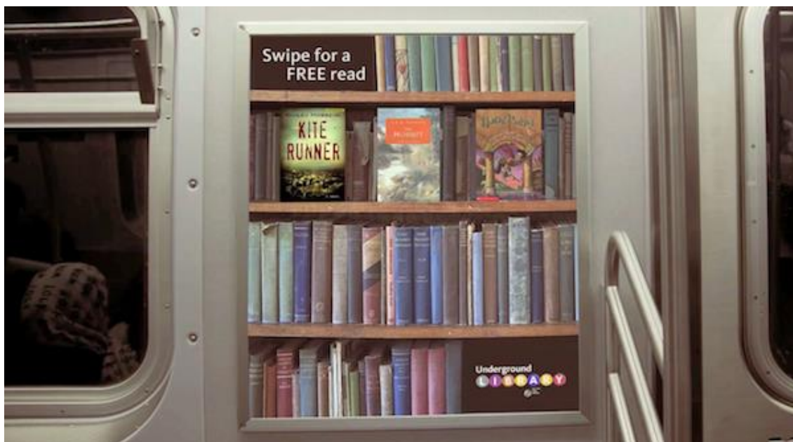
Slika 1. Prikaz jedne od „polica“ s knjigama u podzemnoj željeznici u New Yorku