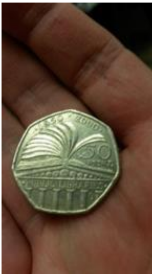
Slika 11. Primjer kovanice koja je u sklopu projekta postavljena u knjige

Koristeći se ovom gerilskom kampanjom, knjižničari londonske knjižnice nastojali su potaknuti nekorisnike knjižnice na korištenje iste na način da im prikažu što sve knjižnica može ponuditi. S druge strane, htjeli su utjecati na korisnike knjižnice da se više angažiraju oko rada knjižnice te da češće koriste knjižničnu građu i usluge. Isto tako, na ovaj način knjižničari su pokušali promijeniti negativnu percepciju knjižnice i knjižničnih usluga kod pojedinaca, ali i potaknuti svijest o potrebi za financijskom potporom knjižnica.