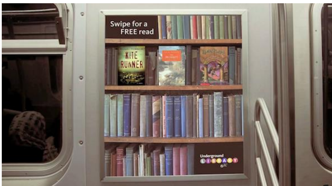
Slika 1. Prikaz jedne od „polica“ s knjigama u podzemnoj željeznici u New Yorku