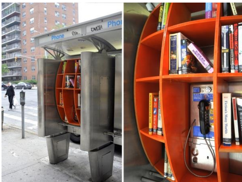
Slika 3. Knjižnica u telefonskoj govornici u New Yorku

Još je jedan primjer gerila marketinga u knjižničarstvu koji dolazi iz New Yorka, a riječ je o malim knjižnicama nalik na plastične kutije koje su, nakon uragana Sandy, postavljene uz pločnike njujorških ulica (slika 4). Naime, neke od knjižnica u New Yorku uništene su u oluji, stoga su knjižničari udruženja „Urban Library Unite New York“ odlučili postaviti male knjižnice dok se oštećene zgrade knjižnica ne obnove. Ovaj projekt osmišljen je kako bi korisnici imali gdje posuđivati knjige, no prvenstveno kako bi znali da knjižničari misle na njih i kada su knjižnice u ruševinama. Iako su knjižničari i zagovornici malih knjižnica svjesni da ovakva knjižnica, s nedovoljnom količinom knjižnične građe, koja često ne bude vraćena, ne može zamijeniti pravu knjižnicu, ističu da male knjižnice postavljene na ulicu, prije svega, služe kao podrška, ne nudeći nužno sve što bi knjižnica trebala, već da bi podsjetili ljude da su knjižnice, kao i njihovi knjižničari, snalažljive, brižne te da su uvijek spremni pružiti odgovor na potrebe svoje zajednice. 35 Ovaj projekt odličan je i vrlo vrijedan primjer gdje knjižnica, na vrlo neobičan način, čak i u teškim trenucima, ukazuje na svoj značaj te stopostotnu usmjerenost i posvećenost zajednici.