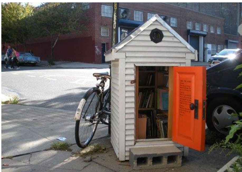
Slika 7. Knjižnica iz projekta „Corner Library“ postavljena u kućicu za pse