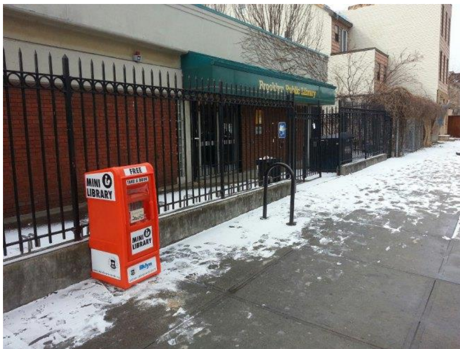
Slika 4. Mala knjižnica na ulicama New Yorka

Nadalje, jedan malo drugačiji projekt gerila marketinga u knjižničarstvu uspješno je proveden u Zuccotti Parku u New Yorku za vrijeme prosvjeda. Ovdje je riječ o narodnoj knjižnici koja je postavila dio svoje građe unutar šatora na stolovima i montažnim policama (slika 5). Ovaj projekt s jednostavnom i skromno dizajniranom mobilnom knjižnicom medijski je bio popraćen, jednim dijelom zbog prosvjeda koji su se ondje događali, ali i zbog čuđenja kod ljudi koje je izazivalo upravo skromno, a funkcionalno osmišljena knjižnica. Knjižničarka Barbara Fister navodi kako je ovaj projekt knjižnica provela kako bi se prosvjednicima ispunilo vrijeme osiguravši im knjige za čitanje, ali i ističe kako je isti pomogao definirati zajednicu kroz kulturno smislen oblik dijeljenja. Nakon što su prosvjednici jedno jutro protjerani iz parka, njihova prijenosna računala i knjige su zaplijenjeni, a narodna knjižnica je svoju pokretnu knjižnicu spremila i odvezla iz parka. Mnogi smatraju da je ovaj gerila projekt putujuće knjižnice dobar odgovor na mobilnost bez prepreka, a „knjižnica na kotačima“ može nastaviti dalje provoditi svoj projekt na različitim mjestima na kojima smatra da je to potrebno. 36