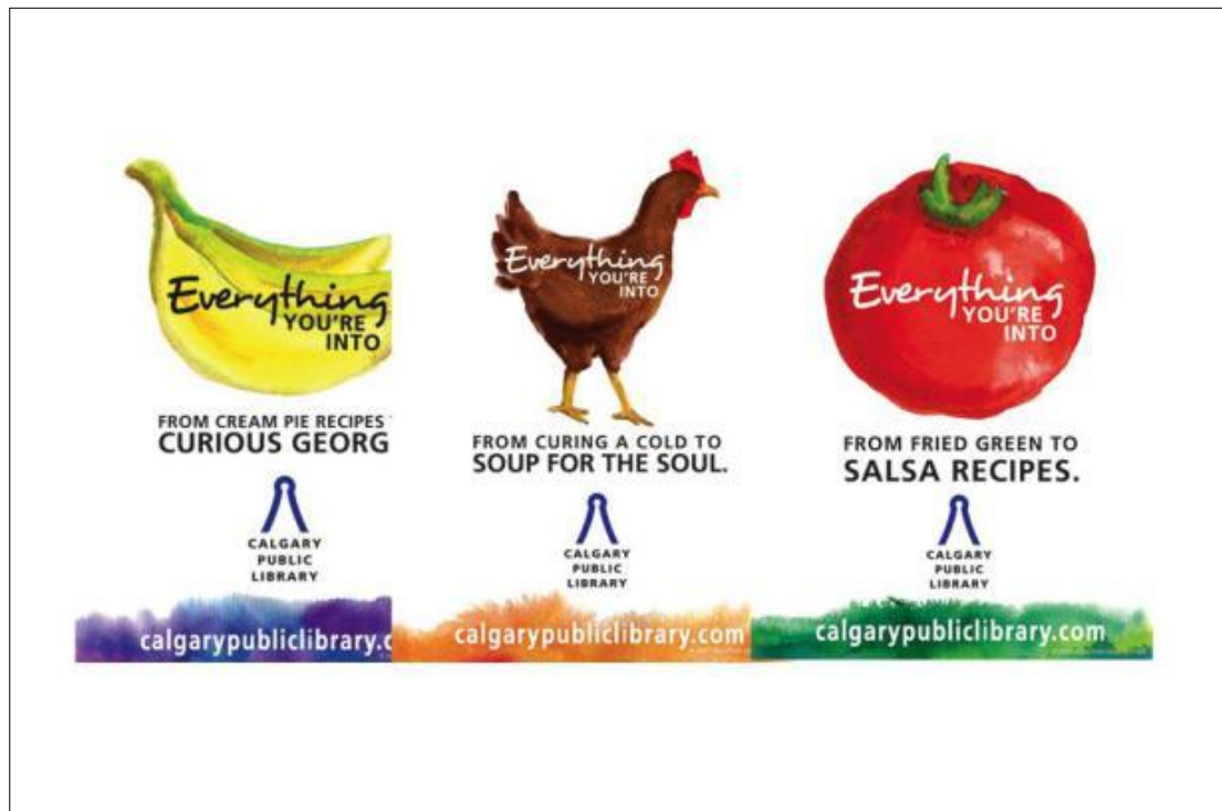
Slika 2. Neki od slogana koji su u sklopu knjižnične kampanje bili postavljeni u trgovinama

Nadalje, Calgary Public Library iz Kanade, prva je narodna knjižnica na tom području koja se okušala u primjeni gerila marketinga za predstavljanje svoje knjižnice i njezinih usluga. Za provođenje svoje kampanje, kanadska knjižnica odabrala je supermarkete u Calgaryju. Ova jedinstvena kampanja pod nazivom „Everything You're Into" cilja na kupce Real Canadian Superstore-a na način da postavljeni pametni oglasi diljem trgovina utječu na ljude kako bi promislili o knjižnici tijekom obavljanja kupovine. Knjižnica polazi od stava da posjeduje za svakoga po nešto te je odlučila šokirati kupce jednostavnim oglasima koji spajaju robu koju kupuju s određenim naslovima knjige. Oglasi su postavljeni unutar svih deset trgovina koje pripadaju istom trgovačkom lancu, a sadržavali su slogane poput „Od roštilja do bika za jahanje“ i „Od recepata za kremaste pite do Znatizeljnog Georga“ (slika 2). Ovakvi oglasi postavljeni su, osim u trgovinama, i po autobusnim stanicama te javnim toaletima diljem Kanade. 33 Korištenjem neobičnih slogana, na kupce se utječe na način da se pobudi želja za saznavanjem što, primjerice, recepti za kremaste pite i naslov „Znatizeljni Georg“ imaju zajedničko. Tako se potiče na veće korištenje same knjižnice od strane njezinih korisnika, ali isto tako se potencijalne korisnike potiče na učlanjenje u knjižnicu i korištenje njezine građe i usluga.