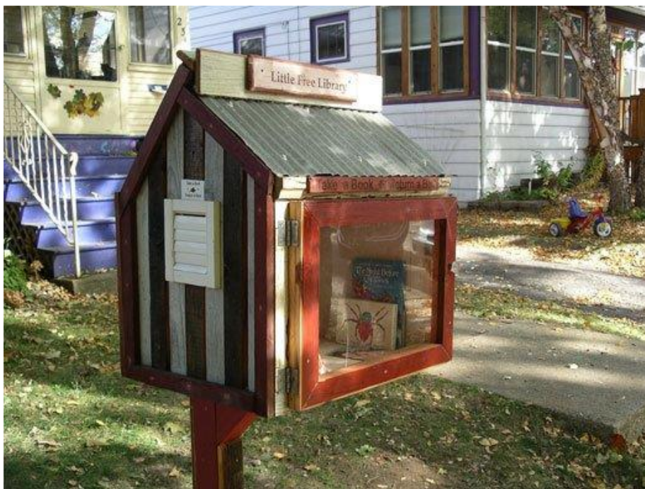
Slika 8. Knjižnica iz projekta „Corner Library“ postavljena u kućicu za ptice

Nadalje, vrlo kreativan primjer gerila marketinga u knjižničarstvu predstavlja stubište jedne američke knjižnice. Naime, knjižničari su stubište oslikali kao hrpu knjiga po kojima se penje prilikom ulaska u knjižnicu (slika 9). Svaka stepenica predstavlja pojedini naslov knjige. Na taj način nastoji se potaknuti ljude na čitanje naslova koji su predstavljeni na stepenicama, ali i na čitanje općenito, jer je dokazano da sve više ljudi sve manje čita. Umjesto da su djeci i odraslima dali pojedine časopise koji potiču na čitanje, odlučili su se za gerila marketing. 39 Osim slanja učinkovite poruke koja potiče na čitanje, na ovaj način je knjižnični prostor osvježen i učinjen privlačnijim.