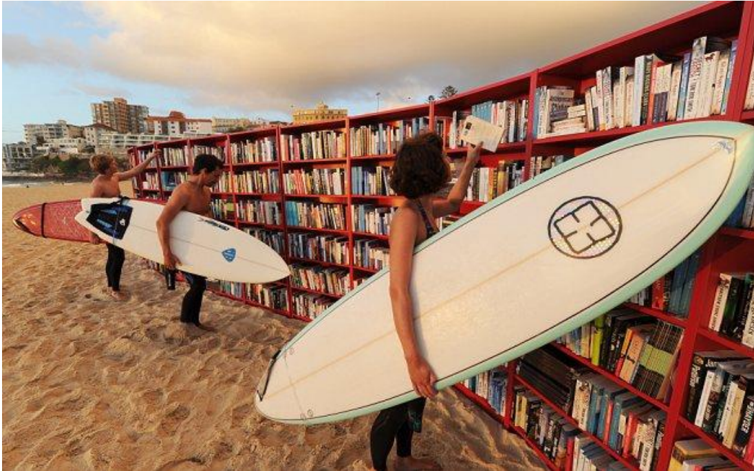
Slika 12. Police s knjigama postavljene na australskoj plaži

biti zanimljivija i prije će se odlučiti na čitanje u ovoj prilici, nego što bi to učinili da im je knjiga dostupna u knjižnici ili pak na nekom uobičajenom mjestu.