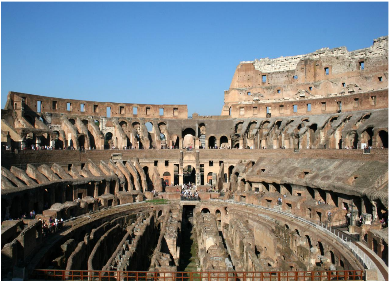
2. Arena i tribine Koloseja u Rimu