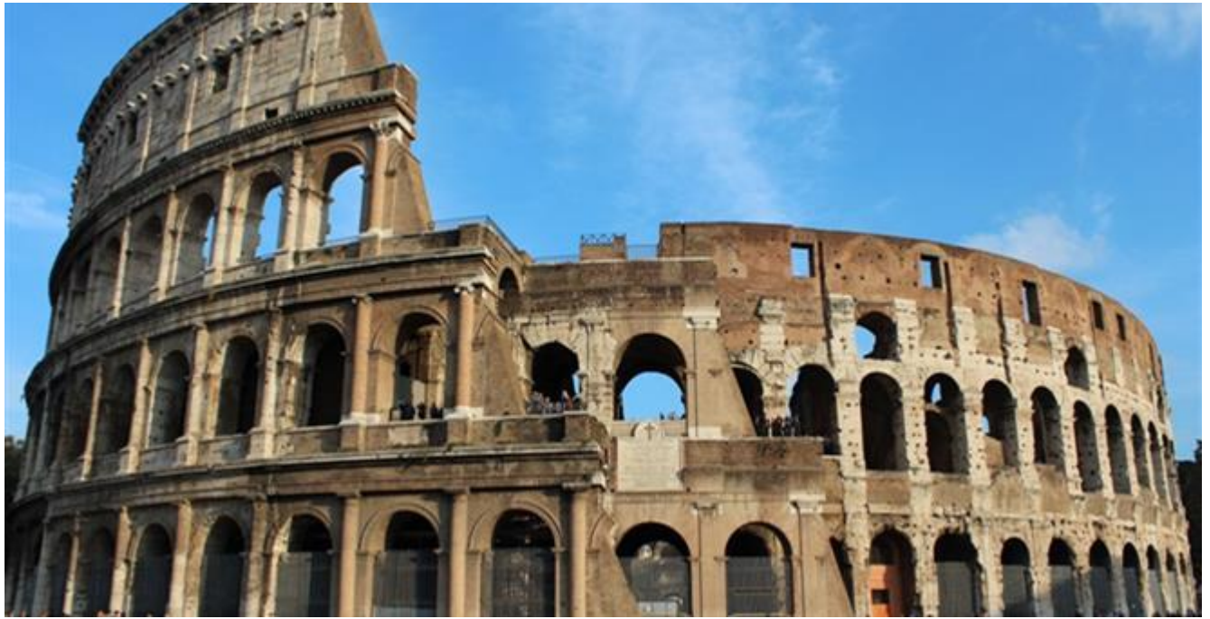
1. Kolosej u Rimu