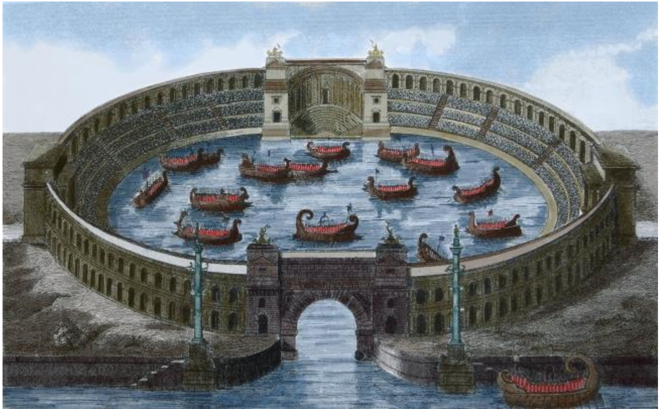
6. Prikaz naumahije