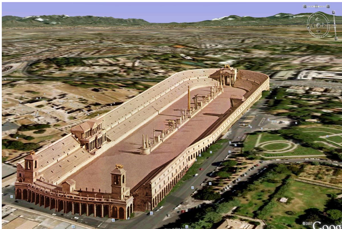
3. Circus Maximus