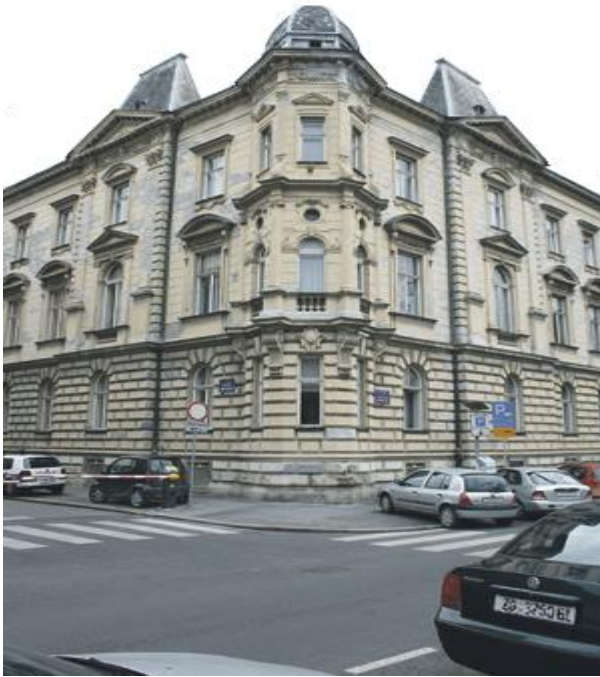
Prilog 3. Zgrada Matice hrvatske

kojoj vlada jednostranačje, zauzeto je stajalište protiv izjave Matice hrvatske kao „antijugoslavenskog“ i „kontrarevolucionarnog“ ispada usmjerenog na „razbijanje bratstva i jedinstva“. 28