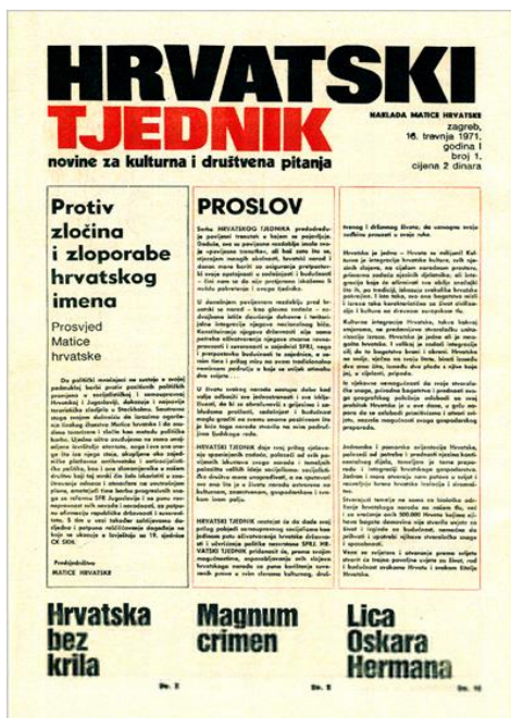
Prilog 5. Naslovnica Hrvatskog tjednika

U memoarima Vice Vukova može se pročitati kako su ne samo književnici već i glazbenici i ostali umjetnici bili lišeni slobode izražavanja u vidu iskaza nacionalnosti. Vice Vukov navodi jedan od takvih slučajeva u kojem opisuje kako su njegove pjesme bile zabranjene na Radiju Sarajevu. Kako je sva kulturna scena Hrvatske tada bila složna pokazuje i objavljivanje priloga u Hrvatskom tjedniku vezan za „slučaj Vukov“. Hrvatski tjednik objavio je prosvjed što ga 2. rujna 1971. godine obznanjuje skupina mladih pisaca na svom Trećem neretvanskom skupu u Metkoviću. Oni su se osvrnuli na zabranu pjesama Vice Vukova, pa navode: „Da je kojim slučajem Vice Vukov književnik njegove bi knjige možda bile spaljene... prosvjedujuemo protiv ovakva obračuna s javnim radnicima i protiv ovakvih inkvizitorskih metoda!“ 42