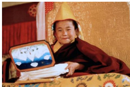
Bild 15 Froschperspektive

Bei dieser Perspektive ist die Kamera so positioniert, dass der Zuschauer den Eindruck erhält auf die Personen und Gegenstände im Film heraufzusehen. Damit erreicht der Kameramann beispielsweise eine Person als mächtig wirken zu lassen.