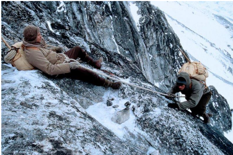
Bild 16 Vogelperspektive

Bei dieser Position der Kamera erreicht man bei dem Zuschauer ein Gefühl der Macht, denn in dieser Kameraperspektive gibt man ihm das Gefühl auf die Personen und Gegenstände im Bild herabzusehen.