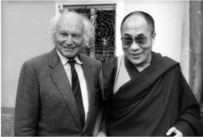
Bild 2 Dalai Lama und Heinrich Harrer

Im Herbst 1939 wurde Harrer mit seinen Kameraden bei einer Himalaya-Expedition nach Beginn des II. Weltkrieges in britische Gefangenschaft genommen. Sie wurden letztendlich in ein Internierungslager im indischen Ort Dehra Dun gebracht. Von dort versuchte Harrer öfters zu fliehen, doch immer wieder vergebens. Im April 1944 gelang es ihm mit einigen Kameraden aus dem