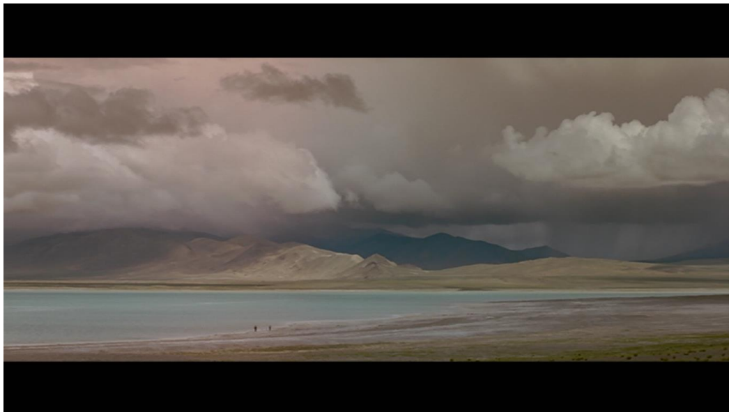
Bild 6 Weit

Hier legt man keinen großen Wert auf Einzelheiten: oft werden dabei die Welt und die Natur dargestellt. Diese Einstellung gilt als gefühlvoll und symbolisiert oft auch etwas, stets wird sie durch Musik im Hintergrund betont. 36