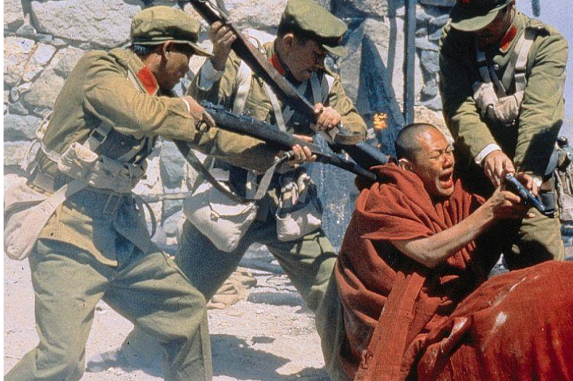
Bild 9 Halbnah