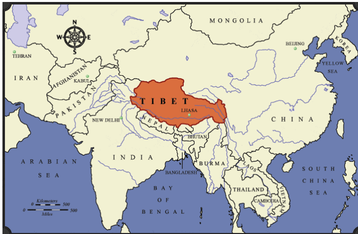
Bild 4 Geographische Darstellung von Tibet