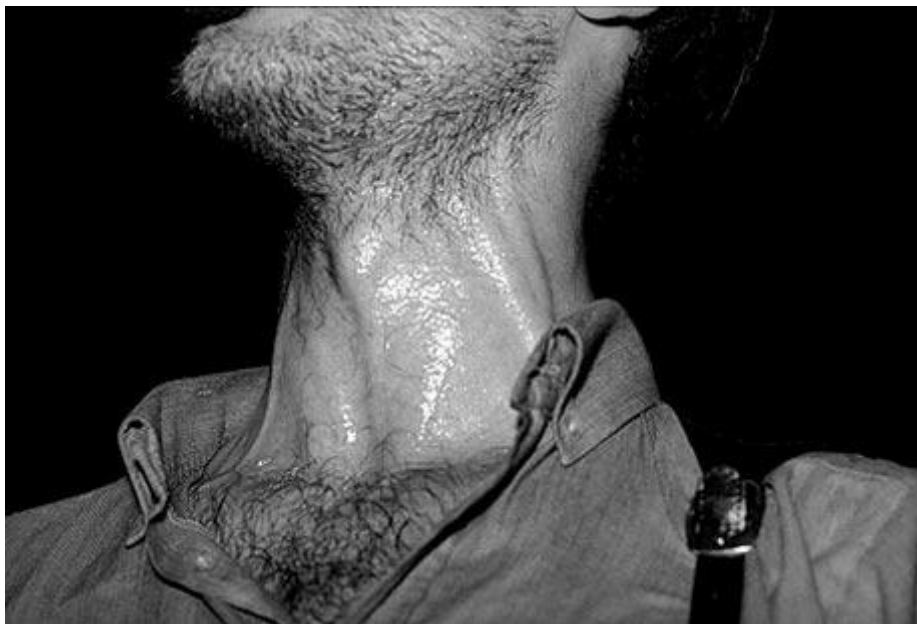
Slika 1. Štulić u svojem opskurnome zanosu; slika 26 je bila dijelom izložbe Protagonisti Novog vala , Ivana Posavca, 2004. godine u Rijeci (nalazi se na naslovnici knjige Moj život je novi val Branka Kostelnika)

O intimnosti koju subjekt priznaje, tj. o svojevrsnome gubitku intimnosti, istini koju subjekt iznosi, također ekраниčnoj slici koju prenosi te čežnji za duhovnom ispunjenosti na sličan je način pisao Dietmar Kemper u svojem radu Krvava glava i bijela prikaza: Noć subjekta . Ondje iznosi teoriju o svjetlu i mraku, o imperativnome postojanju mraka kako bi se razumjelo svjetlo, pa će o tome biti riječ u sljedećem poglavlju.