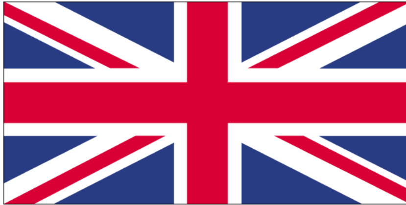
Slika 1. Slika zastave Ujedinjenog Kraljevstva

Može se vidjeti na zastavama Australije, Novog Zelanda te otočja Fidži i Tuvalu, ali i na zastavi Američke savezne države Havaji, iako oni nikada nisu bili u posjedu Velike Britanije. 27