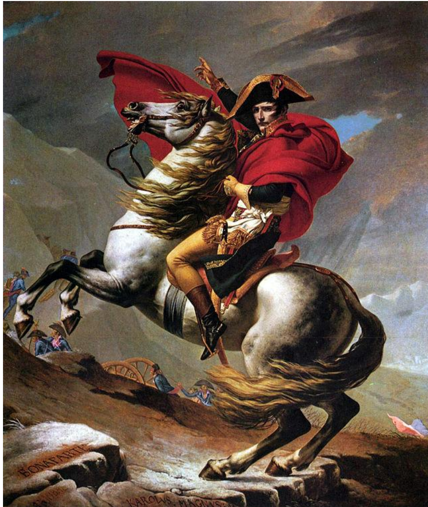
Prilog 1: Jacques-Louis David, Napoleon Bonaparte na prijevoju sv. Bernard , 1801.

i njihovog vođe Maximiliena Robespierrea što će mu u tome trenutku omogućiti napredovanje u vojnoj karijeri, ali i donijeti probleme nakon njihovog pada kada će tijekom 1794. godine na kratko vrijeme završiti u pritvoru. 9