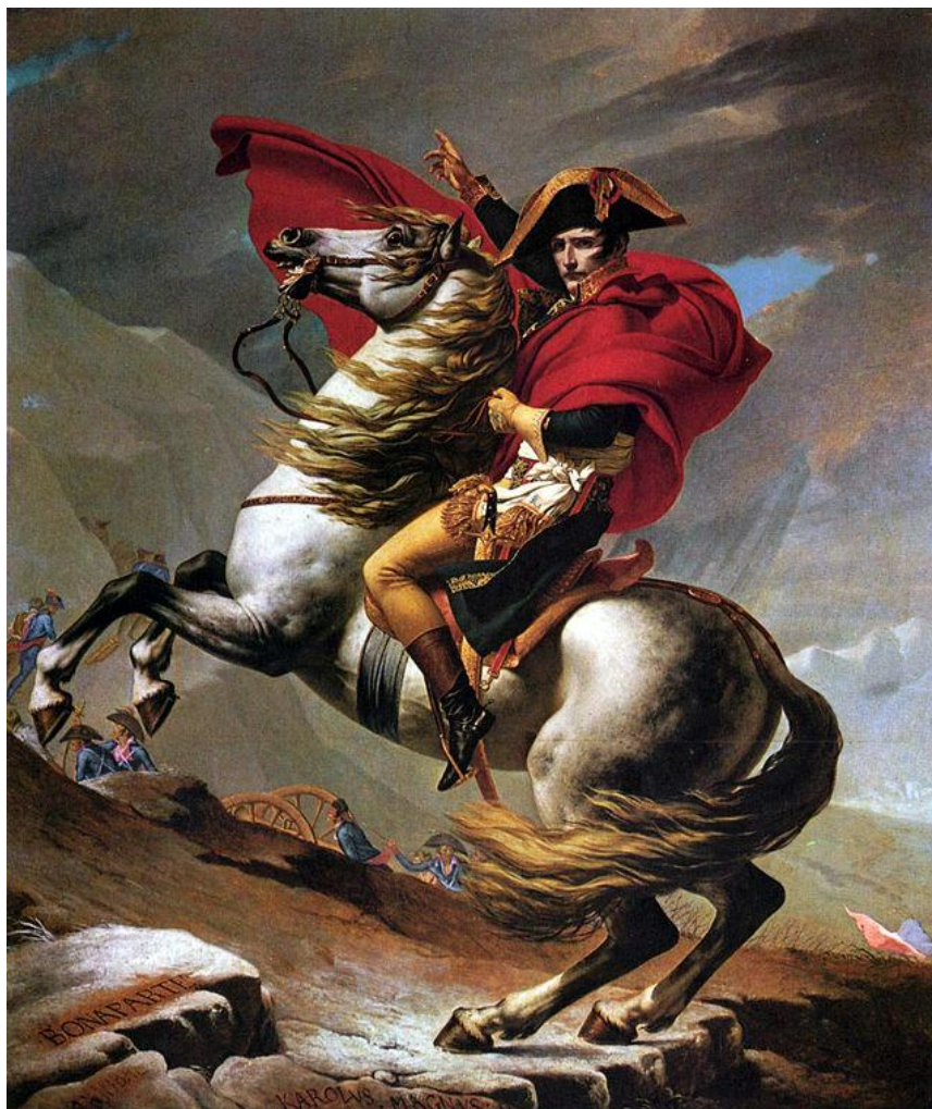
Prilog 1: Jacques-Louis David, Napoleon Bonaparte na prijevoju sv. Bernard , 1801.

i njihovog vođe Maximiliena Robespierrea što će mu u tome trenutku omogućiti napredovanje u vojnoj karijeri, ali i donijeti probleme nakon njihovog pada kada će tijekom 1794. godine na kratko vrijeme završiti u pritvoru. 9