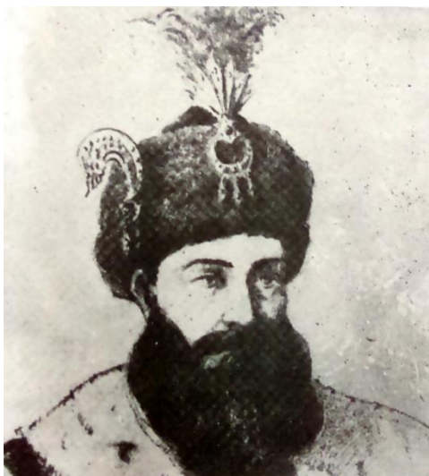
Prilog 9. Mehmed paša Sokolović