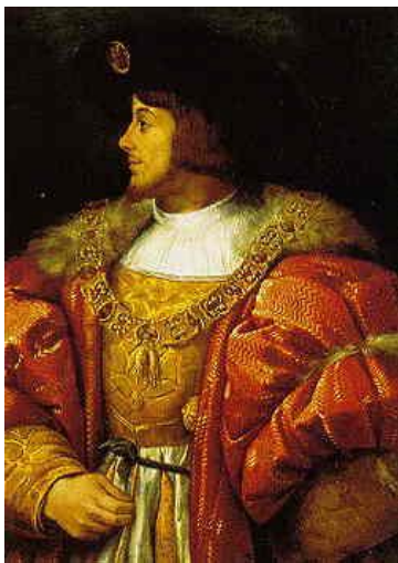
Prilog 3. Ludovik II. Jagelović

Karlo V. Habsburški i francuski kralj Franjo I. bili su kandidati za krunu Svetog Rimskog Carstva, a obojica su obećavali okupljanje cjelokupne europske snage protiv Osmanlija. Za cara je u ožujku 1521. izabran Karlo V., što je dovelo do rata između dvojice vladara. Europa je bila podijeljena, a Osmanlije na čelu sa Sulejmanom I. iskoristile su stanje. 23 Brakom Ludovikove sestre Ane s nadvojvodom Ferdinandom I. Habsburškim, bratom cara Karla V. i njegovim namjesnikom u Austriji, porasla je bojazan Zapolje da Habsburgovci žele preuzeti Ugarsko-hrvatsko kraljevstvo. Francuski je kralj Franjo I. potaknuo Osmansko Carstvo da krenu na Ugarsku kako bi ublažio pritisak koji su Habsburgovci vršili na zapadu njegova kraljevstva. 24