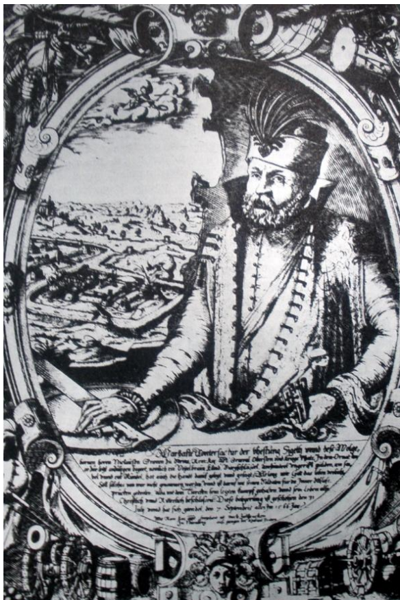
Prilog 7. Nikola Zrinski