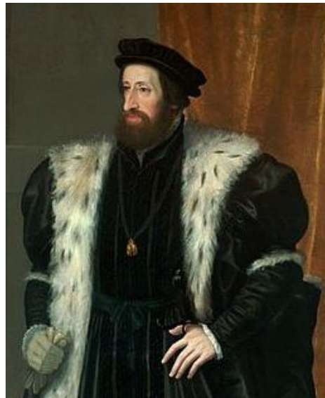
Prilog 5. Ferdinand Habsburški