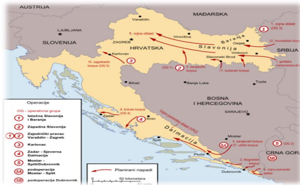
Slika 3. Plan napada JNA na Hrvatsku 89

snage JNA iz Hrvatske. Pobunjeni Srbi imali su veliku ulogu u organiziranju napada jer su oni trebali omogućiti da JNA napadne Hrvatsku. 88