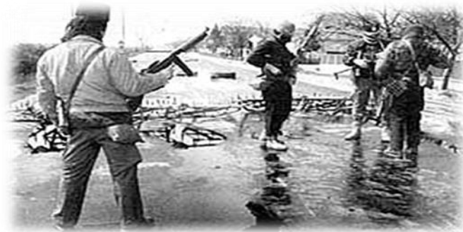
Slika 2. „Balvan- revolucija“ u Slavoniji 70

Tim događajima započela je „balvan-revolucija“. Hrvatska policija je reagirala i poslana je na područje pobune kako bi uvela red. Dio snaga krenuo je ličkom magistralom, a dio helikopterima, no stanovništvo je spriječilo dolazak hrvatske policije ličkom magistralom, a JNA je prisilila tri helikoptera da slete pokraj Ogulina, čime se otvoreno stavila na stranu srpskih pobunjenika. Na stranu pobunjenika svrstali su se i srbijanski mediji koji su pisali samo o ugroženosti Srba od strane hrvatskih vlasti. Također su pisali i o lažnim uzbunama, koje su bile proglašavane na radiju te se na taj način širio strah među srpskim stanovništvom.