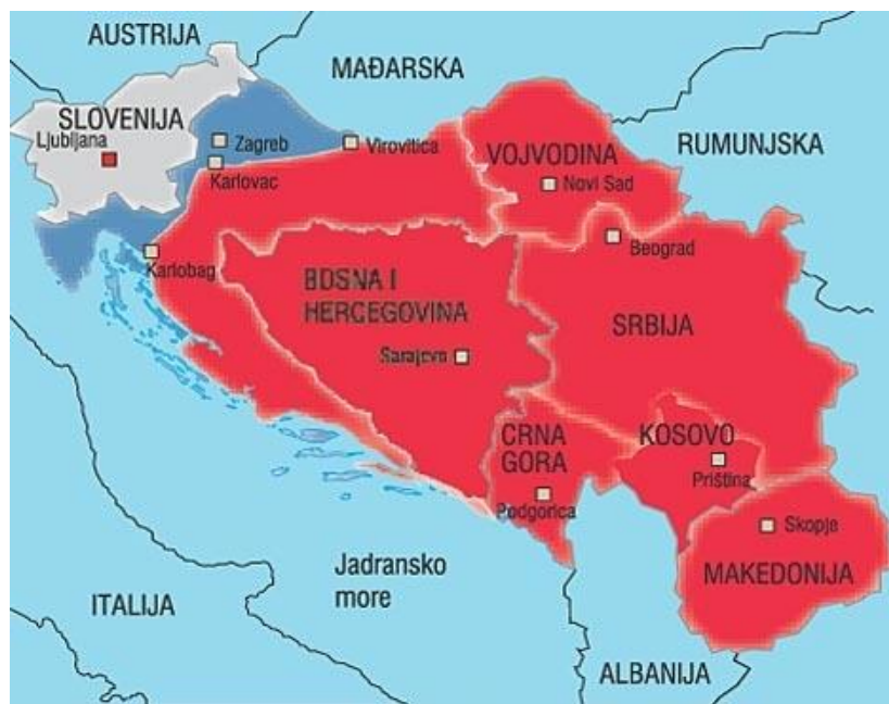
Slika 1. Granice Velike Srbije po Memorandumu SANU 34

Ovi argumenti, kojima je izraženo srpsko nezadovoljstvo, trebali su biti podloga za politiku koja bi vodila uspostavi potpunog nacionalnog integriteta srpskog naroda bez obzira gdje on živio. Memorandum je imao odlučujuću ulogu u oživljavanju srpskog hegemonizma prema područjima gdje je živjelo srpsko stanovništvo odnosno prema područjima koja nikad nisu pripadala srpskoj državi i gdje su srpski prebjezi u XVI., XVII., i XVIII. stoljeću našli svoj dom. 33