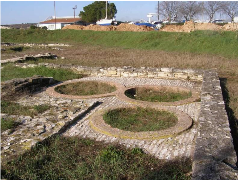
Slika 2. Ostaci rimske vile u Červar Poratu kod Poreča