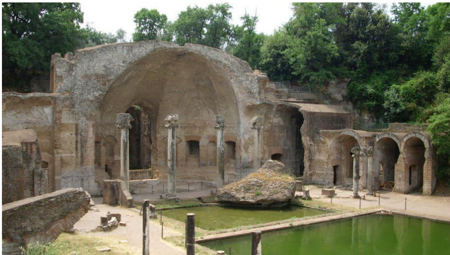
Slika 4. Hadrijanova vila u Tivoliju