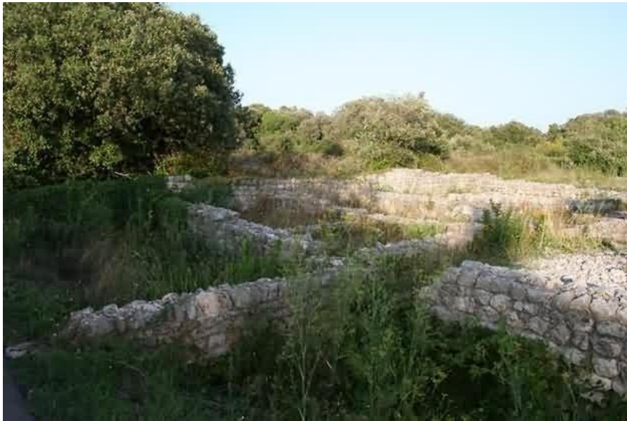
Slika 3. Rimska vila na otoku Ugljanu