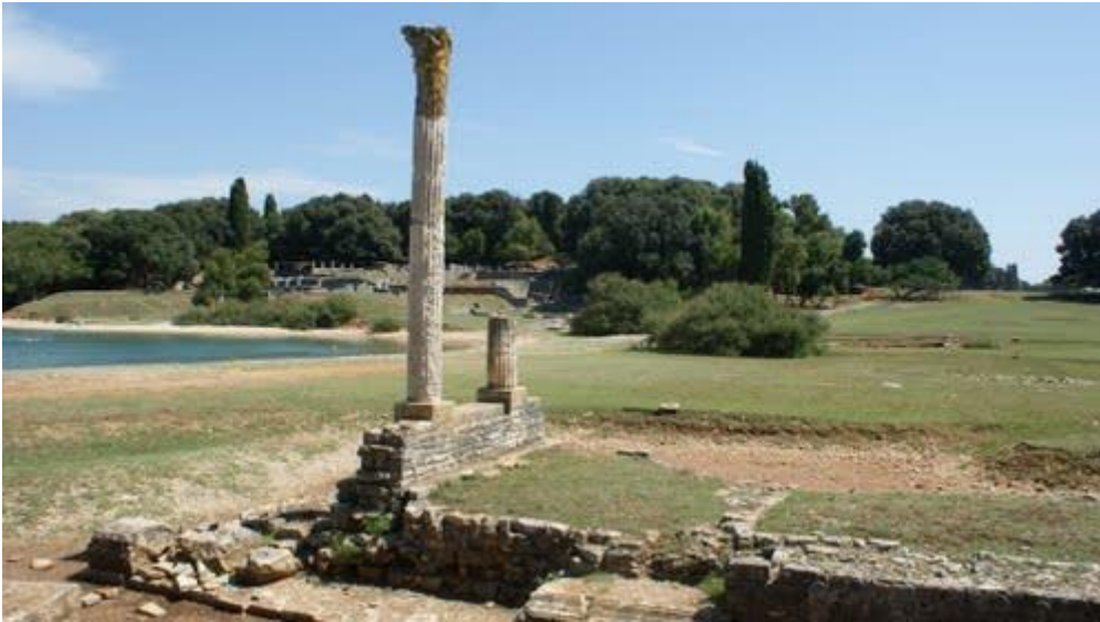
Slika 1. Rimska vila u uvali Verige na Brijunima