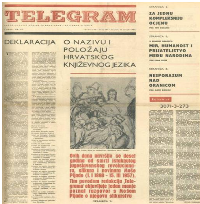
Sl. 1. Deklaracija o nazivu i položaju hrvatskog jezika, naslovnica časopisa Telegram, 17. ožujak 1967. god.