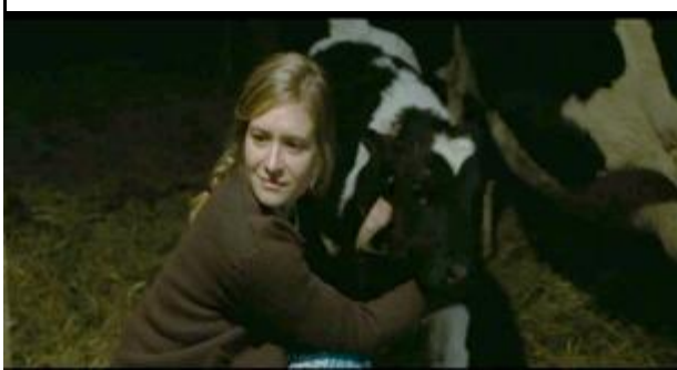
Abbildung 18 Forschperspektive