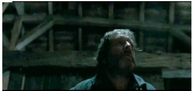
Abbildung 19 Forschperspektive