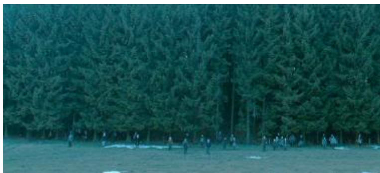
Abbildung 20 Normalsicht