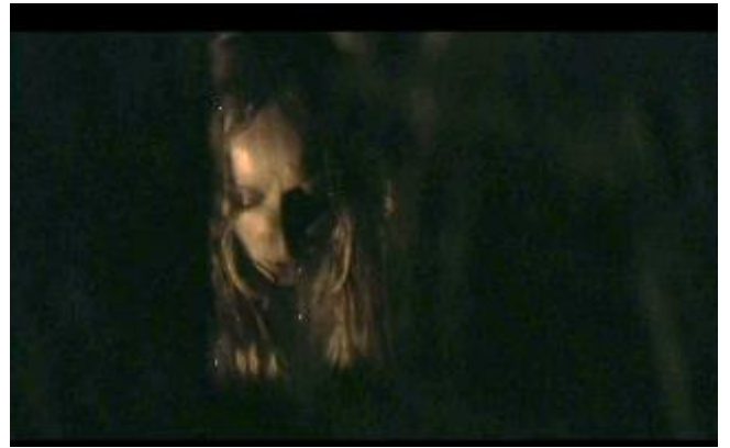
Abbildung 17 Vogelsicht