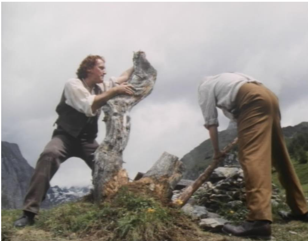
Abb. 10 Kamerasicht: Froschperspektive