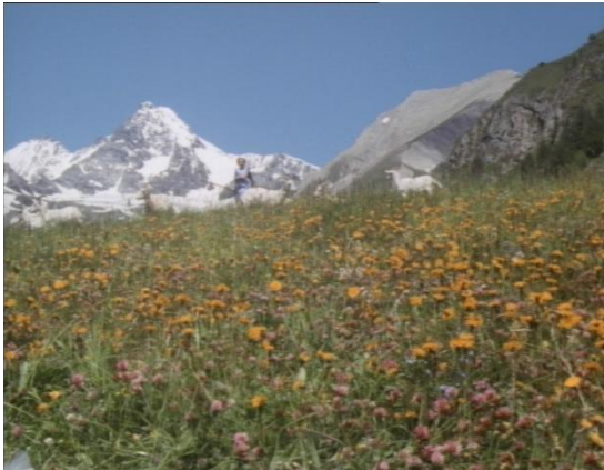
Abb.4 Einstellungsgröße: Panorama Heidi und Geissenpeter auf der Weide