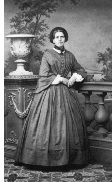
Abb.1 Johanna Spyri