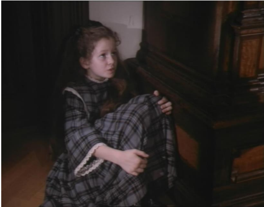
Abb. 9 Kamerasicht: Vogelperspektive