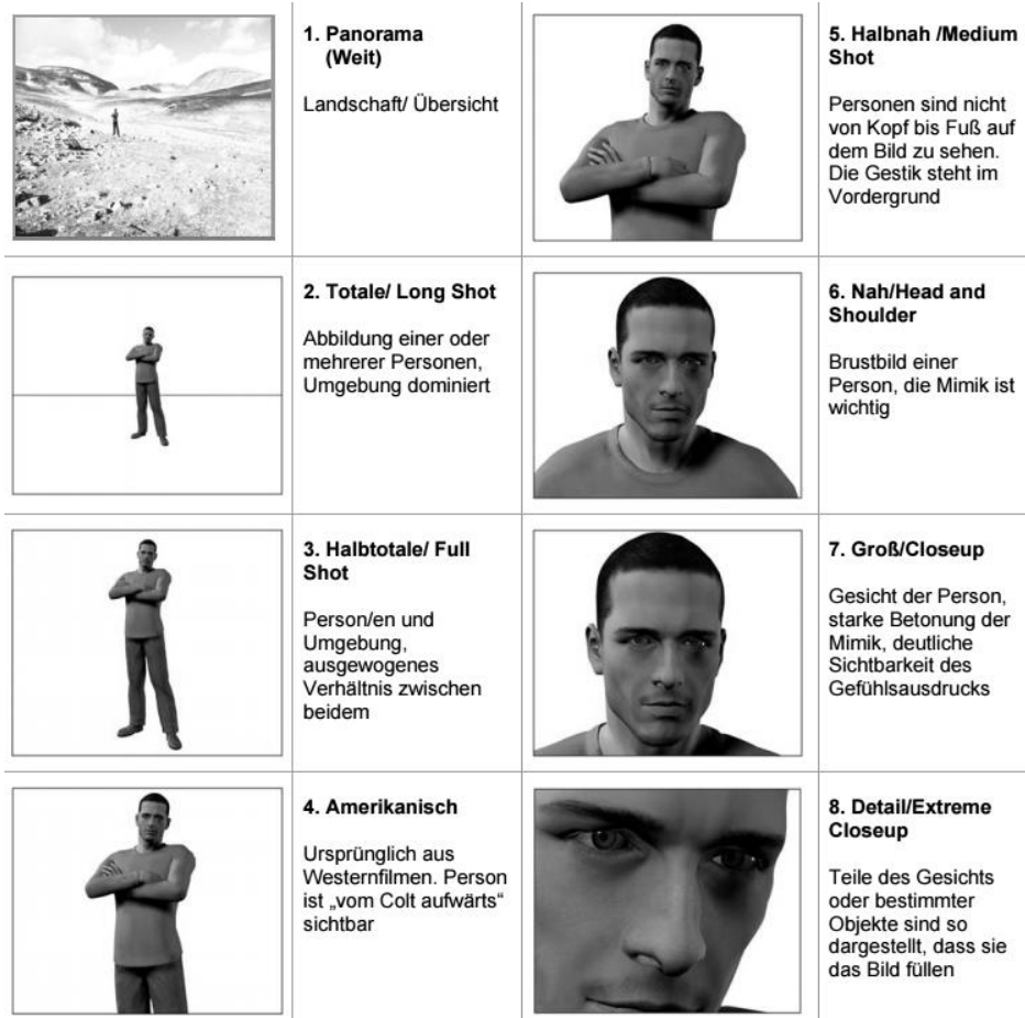
Abb. 3 Einstellungsgrößen der Kamera