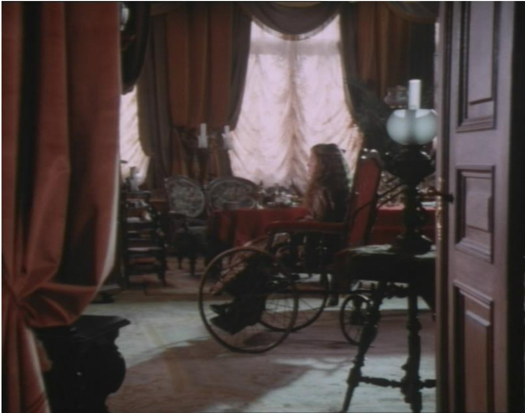
Abb. 11 Kamerasicht: Normalperspektive