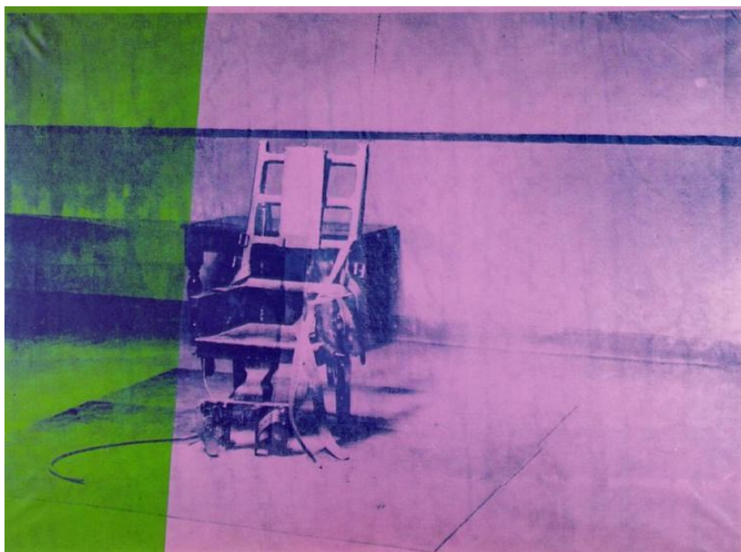
Slika 12. Andy Warhol, Električna stolica, 1967., akril i sitotisak na platnu, 137 x 185 cm