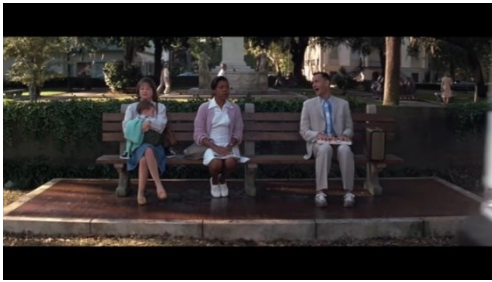
Slika 7 Scena s patikama 57