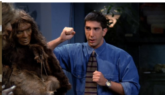
Slika 16 Reklama ručnog sata 66

Prikriveno oglašavanje u serijama ima isti princip kao oglašavanje u filmovima. U serijama se prikazuju proizvodi koje likovi koriste ili konzumiraju. Nema nekakve velike razlike između prikrivenog oglašavanja u serijama i prikrivenog oglašavanja u filmovima. Ono što se može navesti da je zajedničko to je da se prikrivenim oglašavanjem doprinosi brendiranju određene marke ili proizvoda.