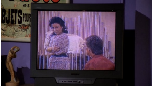
Slika 13 Reklama Sony televizora 63