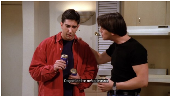
Slika 15 Reklama za pivo 65