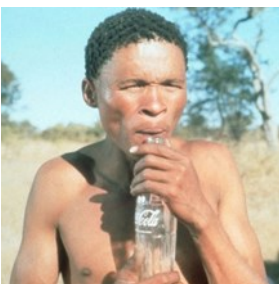
Slika 1 Bušman uzdiže bocu 48

Prikriveno oglašavanje promatrajući marku Coca-cola uočava se već na samom početku filma kada je pilot letio iznad plemena i bacio iz aviona praznu bocu Coca Cole koja je pala kod Bušmana. U filmu ima više od 7 scena koje prikazuju prikriveno oglašavanje kroz primjer boce Coca – Cole. S obzirom da nema informacija koliko je Coca Cola platila reklamu, postoji vjerojatnost da Cola nije trebala biti direktno reklama, nego su producenti uzeli spontano bocu Cole kako bi na komičan način prikazali neznanje ljudi. Iščitavanjem literature navodi se da prikriveno reklamiranje proizvoda kao marketinška strategija postaje zastupljenija 1990-tih i 2000-tih.