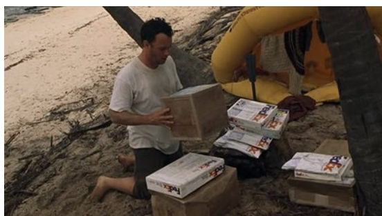
Slika 3 Prikaz FedEx – ovih paketa na pustom otoku 52

Ovaj film je primjer prikrivenog oglašavanja jer FedEx kao tvrtka uistinu postoji. Ovo je jedan od rijetkih primjera gdje se cijela radnja vrti oko jedne reklame. Film započinje sa slikom kamiona od FedEx -a. Bitnim se smatra navesti da FedEx nije platio da bi se reklamirao u filmu. To je bila ideja producenata da FedEx uđe u film jer on prikazuje klasičan život i način na koji živi jedan Amerikanac u to doba. 51