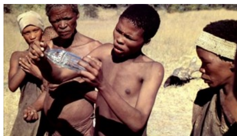
Slika 2 Bušman reprezentira bocu Coca Cole 49