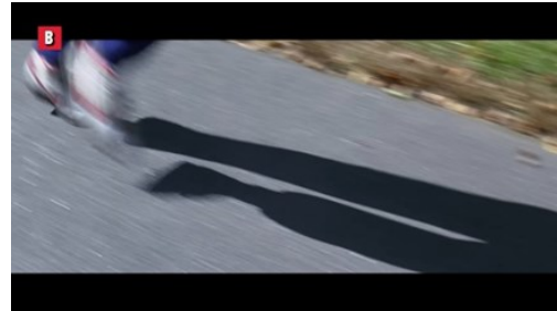
Slika 8 Trčanje kroz SAD 58

Tijekom prikaza kratke analize filmova u ovome pod poglavlju može se vidjeti veliki broj reklama koje su imale suradnju sa prethodnim filmovima. Iz priloženih slika se mogu vidjeti primjeri oglašavanja pojedinih proizvoda. Gotovo svi filmovi koji postoje imaju određene skrivene reklame kojih gledatelji nisu svjesni, ali te reklame utječu na podsvijest gledatelja da im potaknu želju za njima.