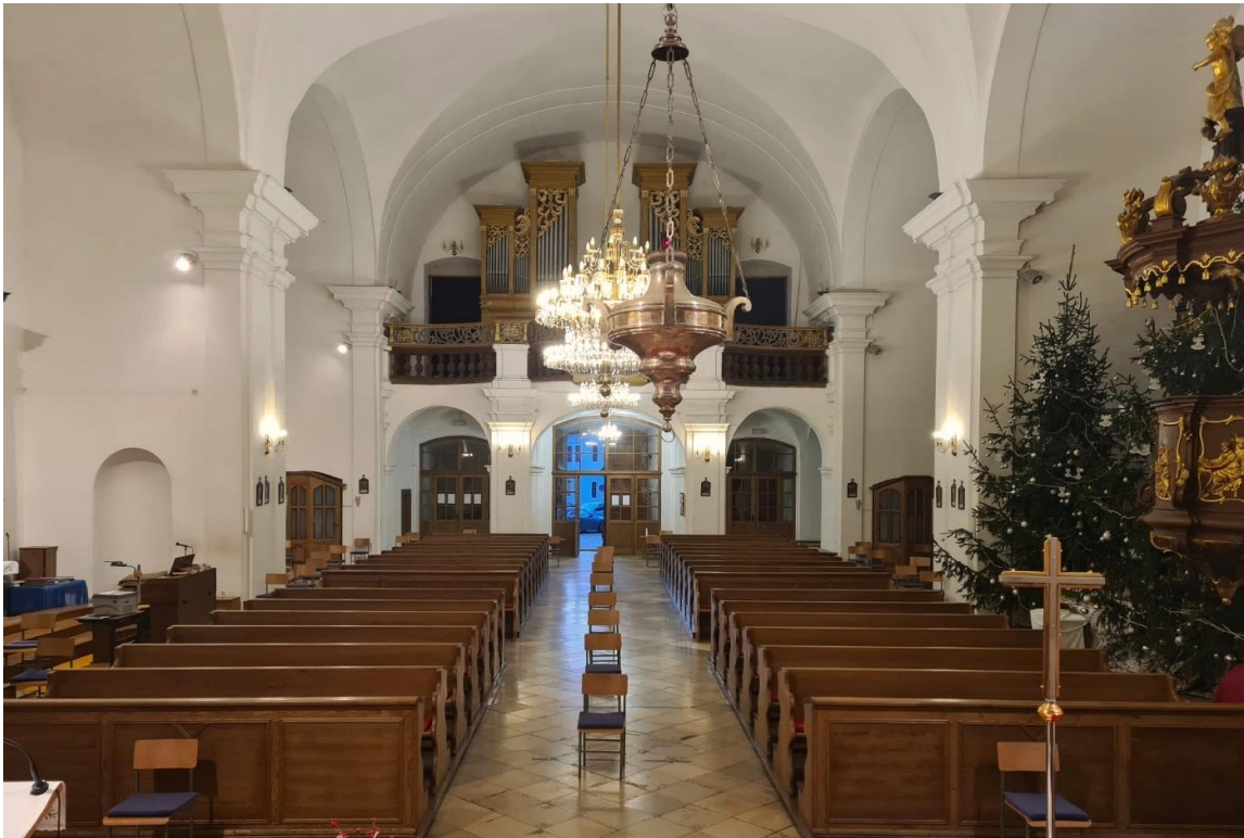
Slika 20. Fotografija interijera crkve sv. Mihaela