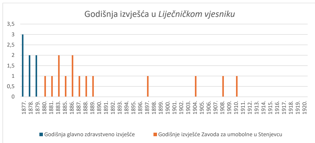
Grafikon 2. Godišnja izvješća u Liječničkom vjesniku.

najveća zastupljenost. 111 Već od 1909. do 1920. godine broj članaka varirao je od jednog do tri po godini. Najveći broj članaka napisao je Ivan Žirovčić, njih 35, od kojih se 26 odnosi na forenzičko-psihijatrijska vještačenja. Navedeni podatak potvrđuje činjenicu kako se psihijatrija kao znanost u Hrvatskoj najviše razvijala u Zavodu.