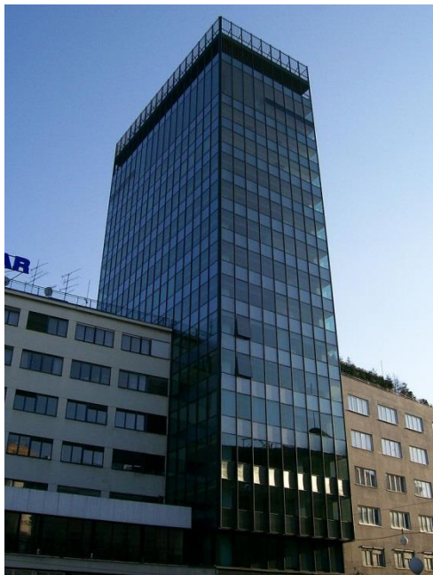
Slika 11. Neboder