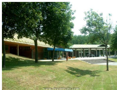
Slika 26. Pampika