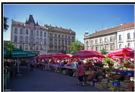
Slika 17. Britanac