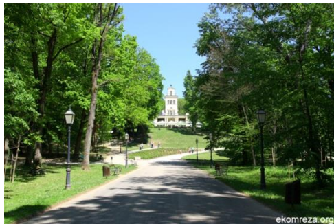
Slika 13. Maksić