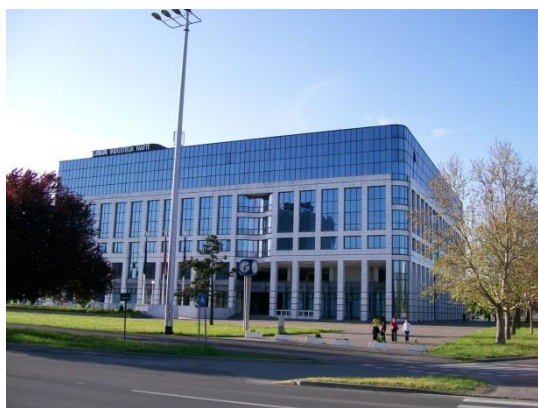
Slika 7. Karingtonka

(kada Zagrepčani kažu „Trg“ uvijek misle na glavni zagrebački trg, trg bana Josipa Jelačića), u srcu glavnoga grada, nalazi se „Neboder“. U trenutku otvorenja 1959. godine bio je najviša i najmodernija zgrada u tadašnjoj Jugoslaviji. Na samom vrhu zgrade, na 16. katu, nalazi se Zagreb Eye, vidikovac odakle se pruža jedinstven pogled na glavni trg, na Kaptol, Gradec, Gornji i Donji grad te na razne prekrasne građevine, trgove, ulice i parkove.