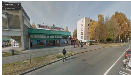
Slika 21. Fedika