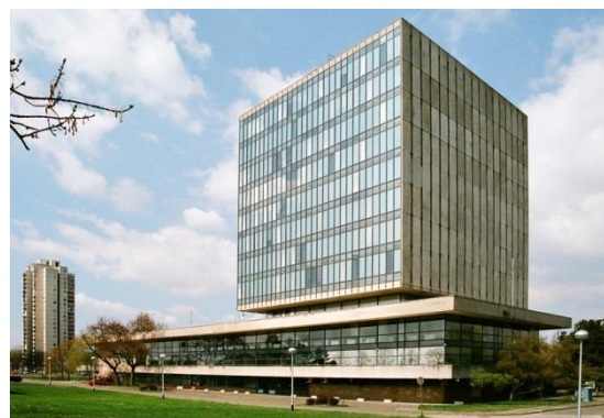
Slika 8. Kockica