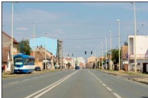
Slika 23. Štrosika