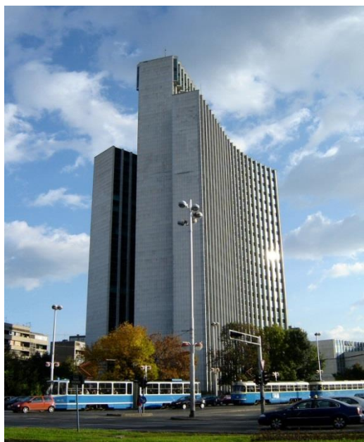
Slika 9. Zagrepčanka