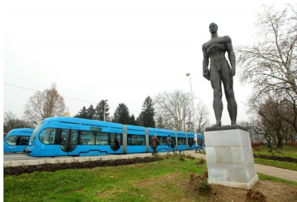
Slika 19. Pimpek-plac