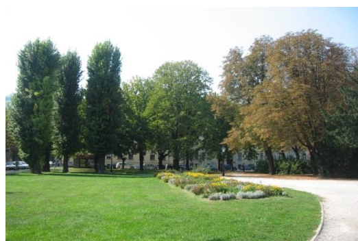
Slika 16. Mažuranac