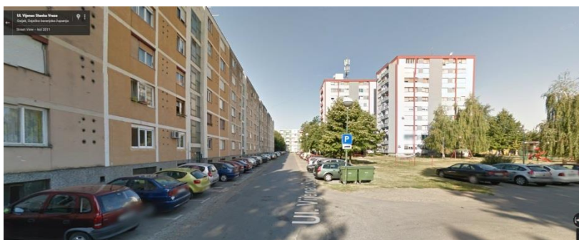
Slika 22. Stankika