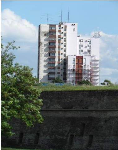
Slika 27. Četverolist