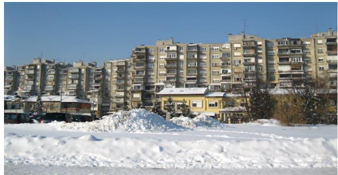
Slika 3. Kineski zid