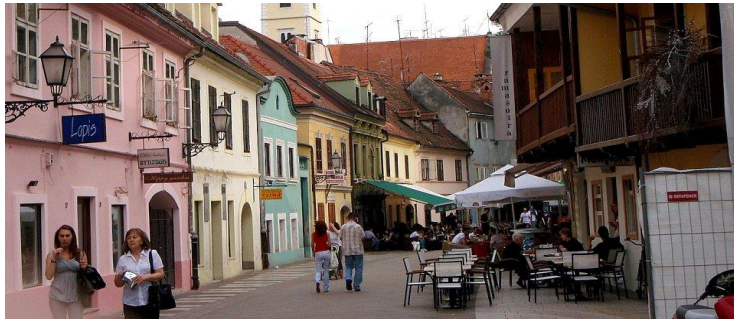
Slika 14. Tkalča