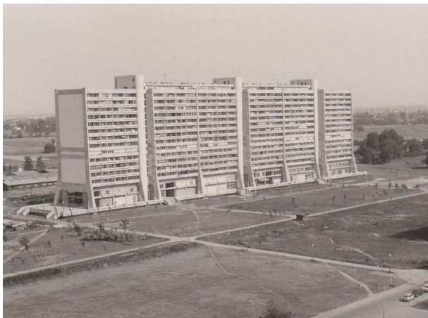
Slika 4. Superandrija