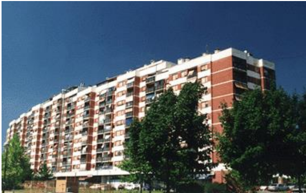
Slika 1. Prostitutka

stubištu zgrade, a „ Visibaba “ zbog jedne starije žene koja je u toj zgradi počinila samoubojstvo objesivši se.