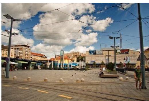
Slika 15. Kvatrič