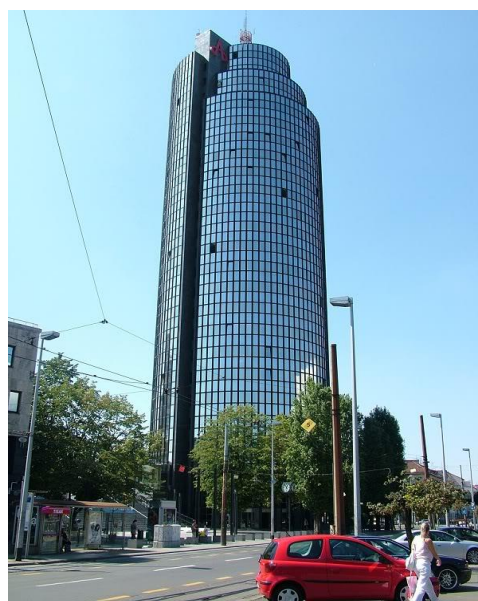
Slika 10. Cibona