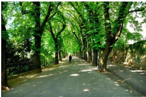
Slika 12. Štros

Zagreplčani vole građevinama u svojem gradu davati razna imena. Isto tako vole skraćivati već postojeća imena. Pa tako prekrasno Strossmayerovo šetalište postaje „Štros“, park Maksimir je „Maksić“, a Tkalčićeva ulica „Tkalča“. Ni trgovi nisu lišeni nadimaka pa je Kvaternikov trg preimenovan u „Kvatrić“, trg Ivana Mažuranića je „Mažuranac“, a Britanski trg „Britanac“.