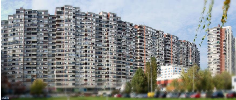
Slika 2. Mamutica