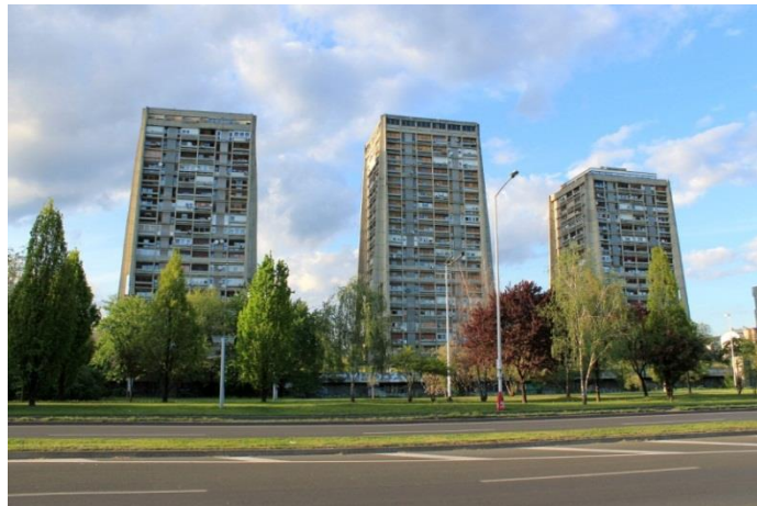
Slika 6. Rakete