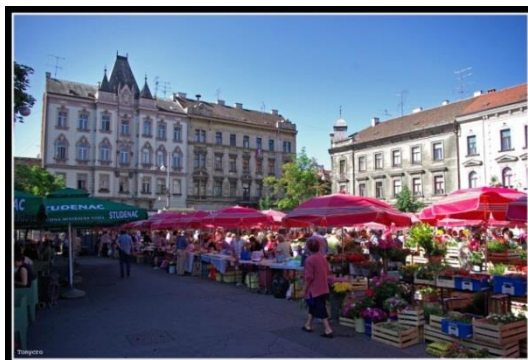
Slika 17. Britanac