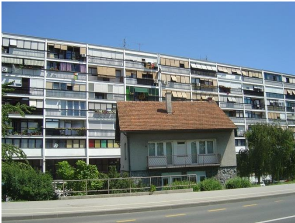
Slika 5. Limenke