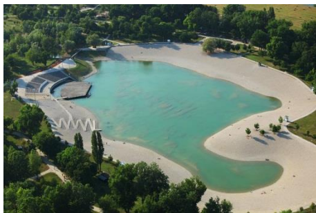
Slika 18. Bandek

Poznato zagrebačko umjetno jezero Bundek preimenovan je u „ Bandek “, prema gradonačelniku Milanu Bandiću. Jedno od najneobičnijih imena zasigurno nosi legendarna skulptura, tzv. „ Pimpek-plac “ koja se nalazi na križanju Maksimirske ulice i Svetica, tik uz nogometni stadion Maksimir. Skulptura je postavljena 1957. godine, a mnogi Zagrepčani ju oduvijek zovu tim neobičnim nadimkom. Riječ je o kipu Bacača diska. U bivšoj državi tradicionalno se na Uskrs Bacaču diska bojalo međunožje. Nakon nedjeljnih uskršnjih misa, obitelji bi odlazile do „ Pimpek-placa “ pogledati je li i ove godine „delala farba“. Zbog velike frekvencije Dinamovih navijača, spomenik je često bojan u plavu boju.