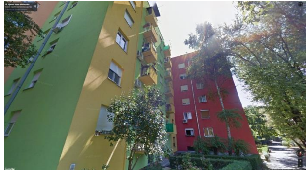
Slika 28. Baterije