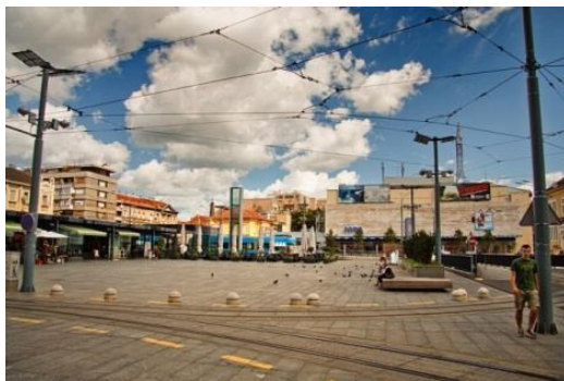
Slika 15. Kvatrić