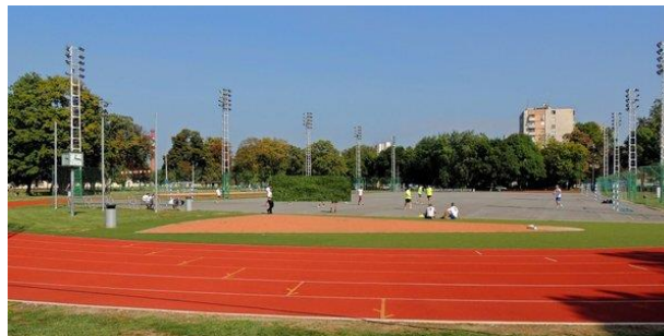
Slika 24. Srednjika