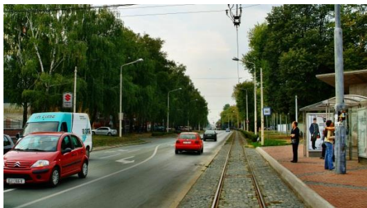
Slika 20. Donjika