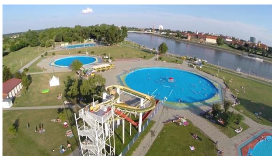
Slika 25. Kopika