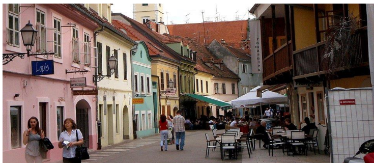
Slika 14. Tkalča