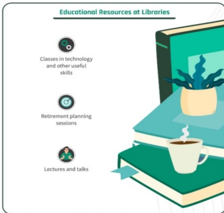
Slika 4. Obrazovni resursi u knjižnicama