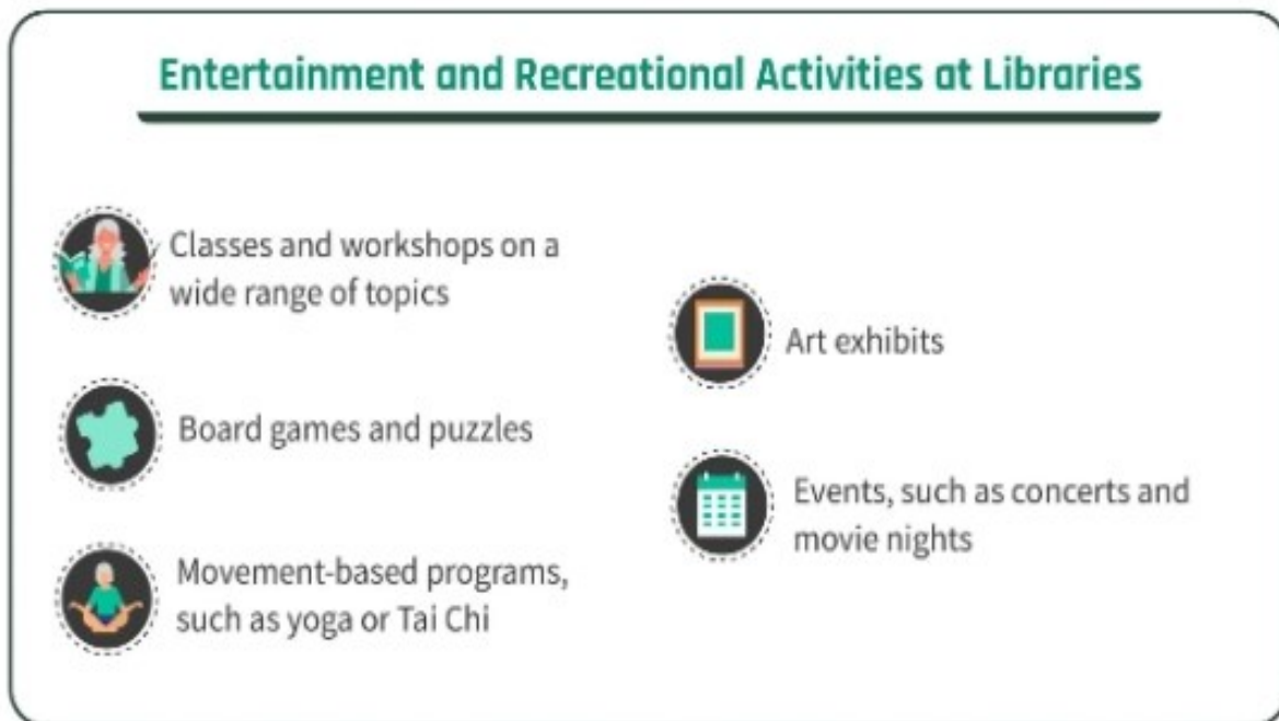
Slika 3. Zabavne i rekreacijske aktivnosti u knjižnicama