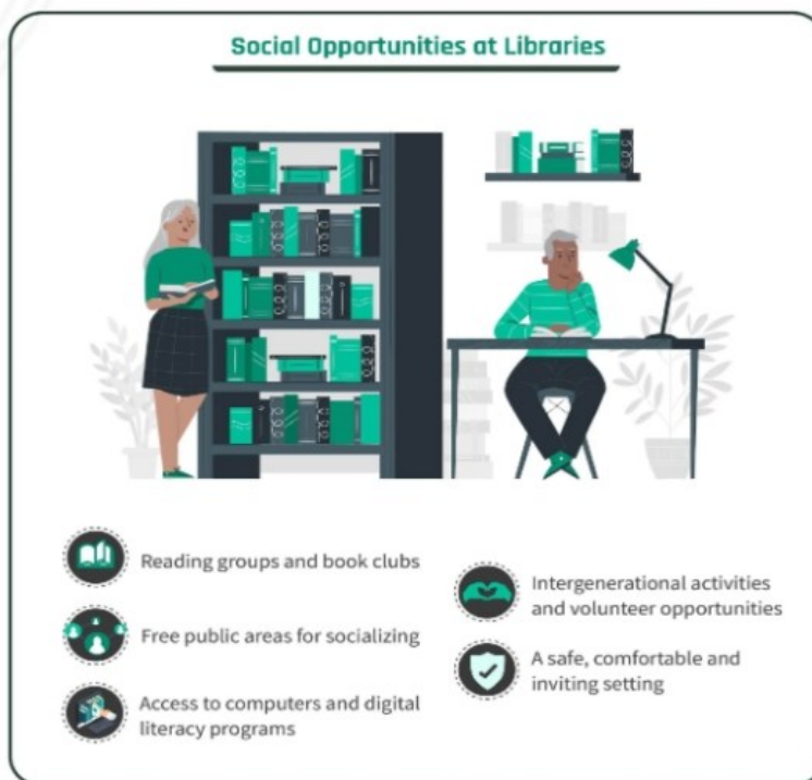
Slika 2. Društvene mogućnosti u knjižnicama