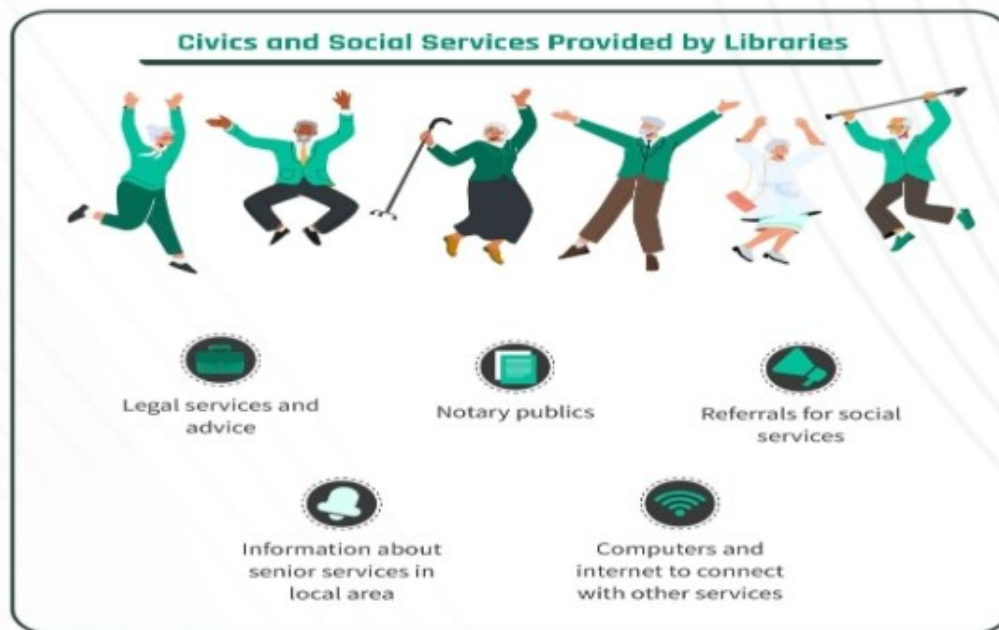
Slika 5. Gradanske i društvene usluge osigurane od strane knjižnice