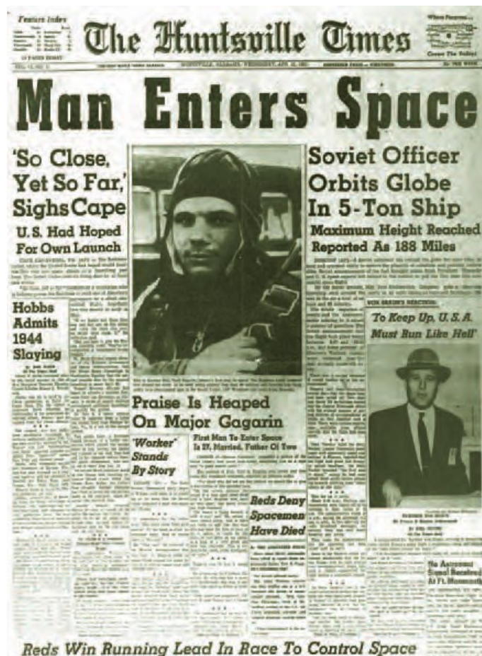
Slika 4. Naslovnica američkog časopisa Times o Gagarinovu letu