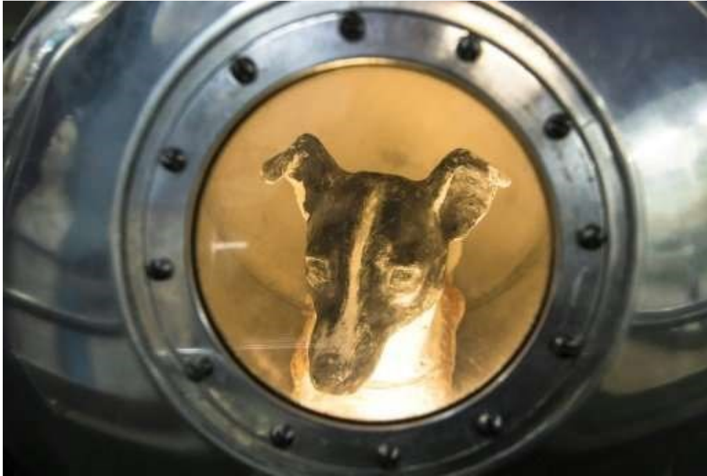
Slika 2. Lajka u Sputniku 2