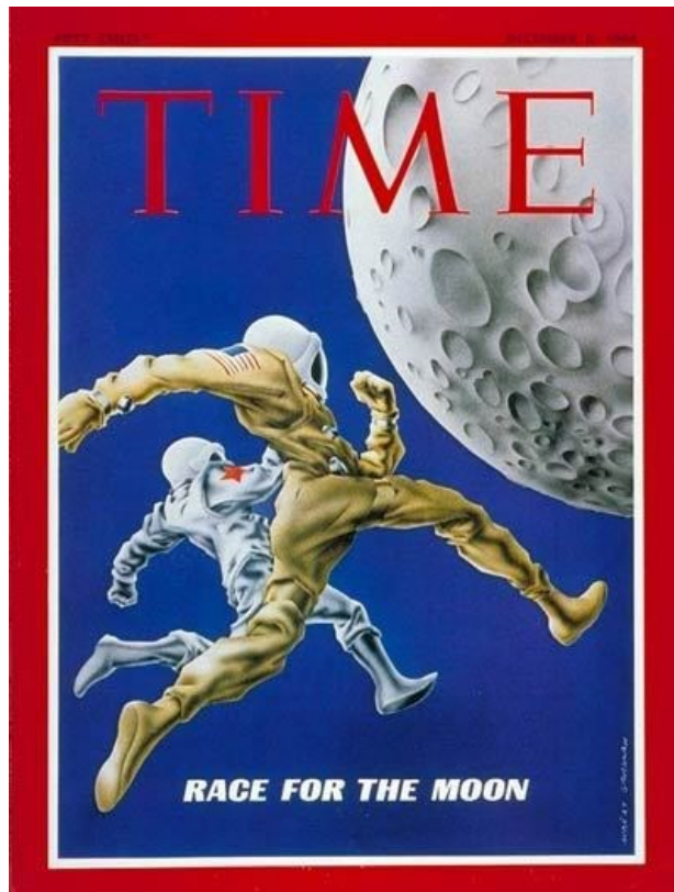
Slika 7. Naslovnica časopisa Time