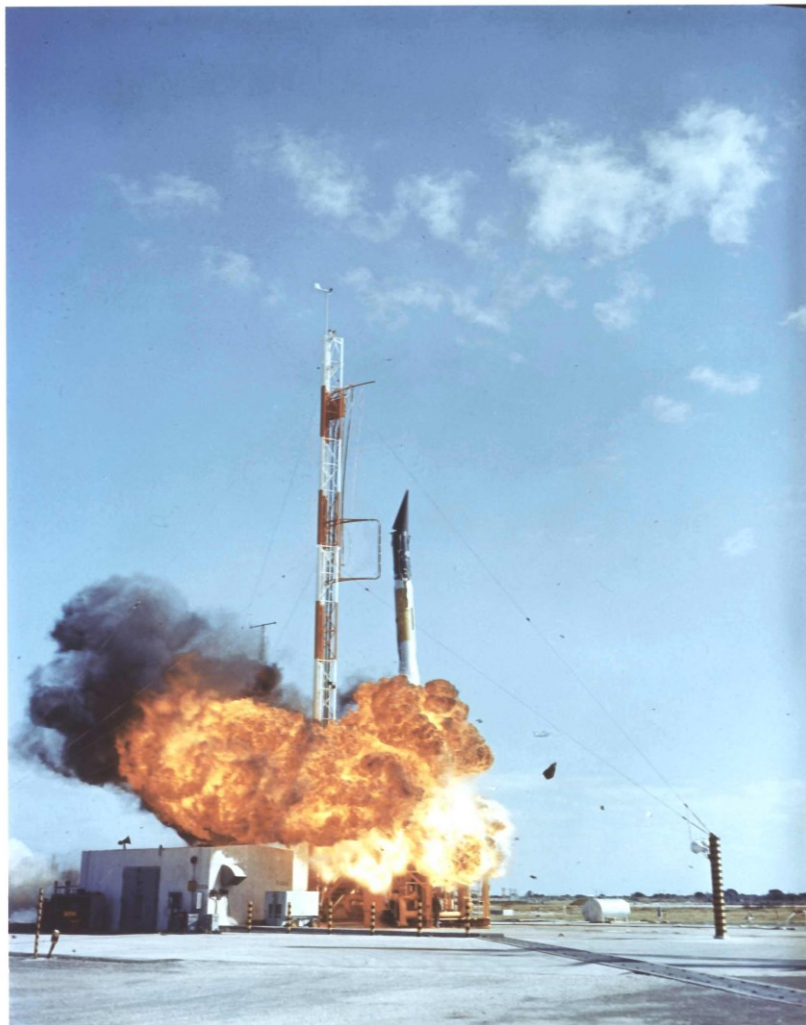
Slika 3. Projekt Vanguard

od strane Hruščova. U prvom pokušaju da sustignu Sovjetski Savez, Sjedinjene Američke Države doživjele su neočekivanu situaciju. Pred televizijskim kamerama američki satelit Vanguard eksplodirao je tri metra iznad tla. Poniženje je bilo potpuno, a ugled Sjedinjenih Američkih Država dodatno poljuljan. U časopisu Pravda uz naslov Predstava i stvarnost stavljene su dvije slike; Vanguard prije polijetanja na prvoj i plameni ostatci na drugoj. Poruka je bila i više nego jasna. Britanski mediji nisu mogli suspregnuti cinizam iako je bila riječ o državi saveznicu. Časopis London Daily Herald na prednjoj je stranici 7. prosinca 1957. objavio naslov „Oh, kakva sramota“. 55