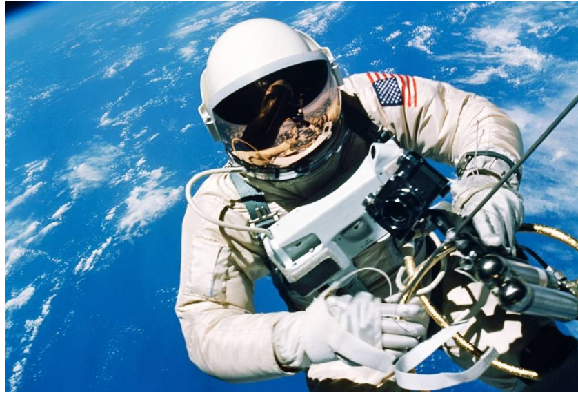
Slika 6. Edward H. White u svemiru