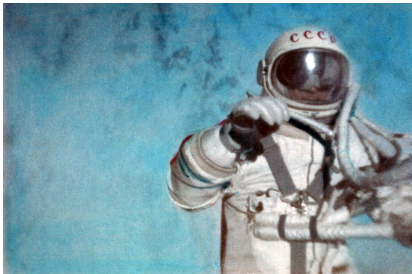
Slika 5. Aleksej Leonov u svemiru

Sjedinjene su Američke Države ubrzo odgovorile na sovjetski uspjeh lansiranjem letjelice Gemini IV 3. lipnja 1965. godine. U letjelici su bili Edward H. White i Jim McDivitt, pripadnici novoizabranih astronauta projekta The Gemini Nine . White je izašao iz letjelice te je izvan letjelice bio 20 minuta i tako postao prvim Amerikancem koji je „šetao“ svemirom. 97