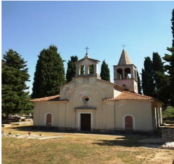
Slika 1. Fotografija župnog ureda Žman 27