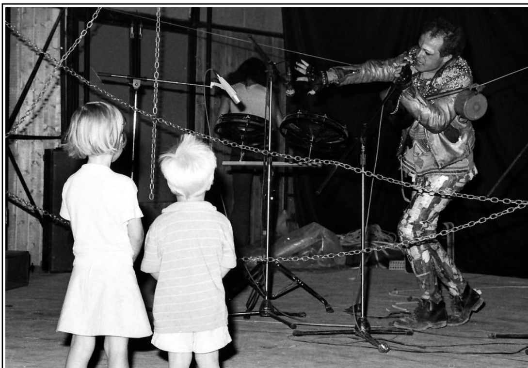
Nastup Satana Panonskog 23. kolovoza 1988. godine u „šatoru Guliver“ u Zagrebu; djeca uživaju u njegovu pankerskom nastupu 11

Satan Panonski prvi na ovim prostorima na scenu donosi tzv. tijelo otpora kroz glazbeni performans, uvodi brutalnu tjelesnu izvedbu koja uključuje samoozljeđivanje na sceni, te time zaslužuje mjesto u povijesti domaćeg performanca. (Anđelković, 2015: 2)