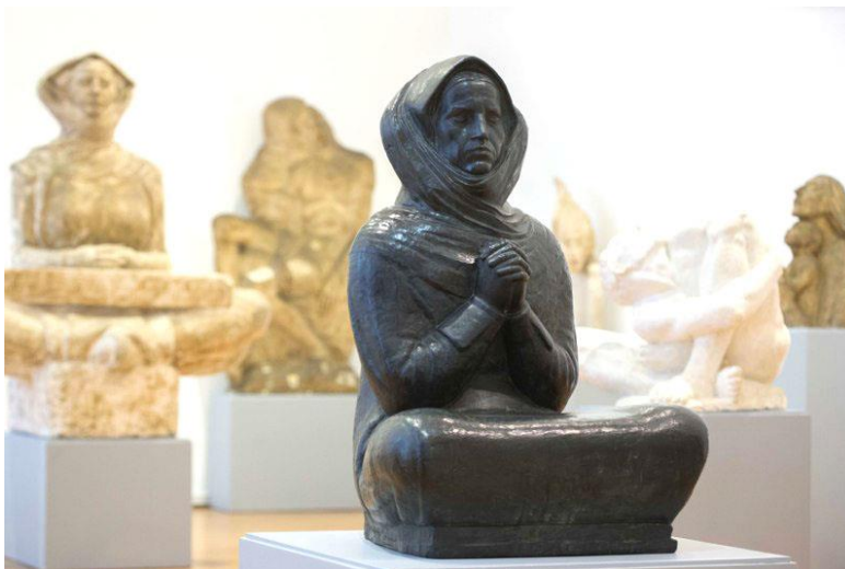
Slika 12. Kip koji prikazuje Meštrovićevu majku u molitvi