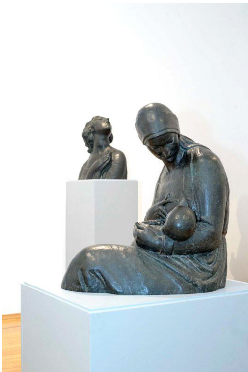
Slika 11. Olga doji Tvrka