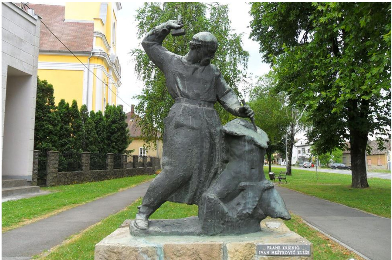
Slika 7. Frane Kršinić, Ivan Meštrović kleše