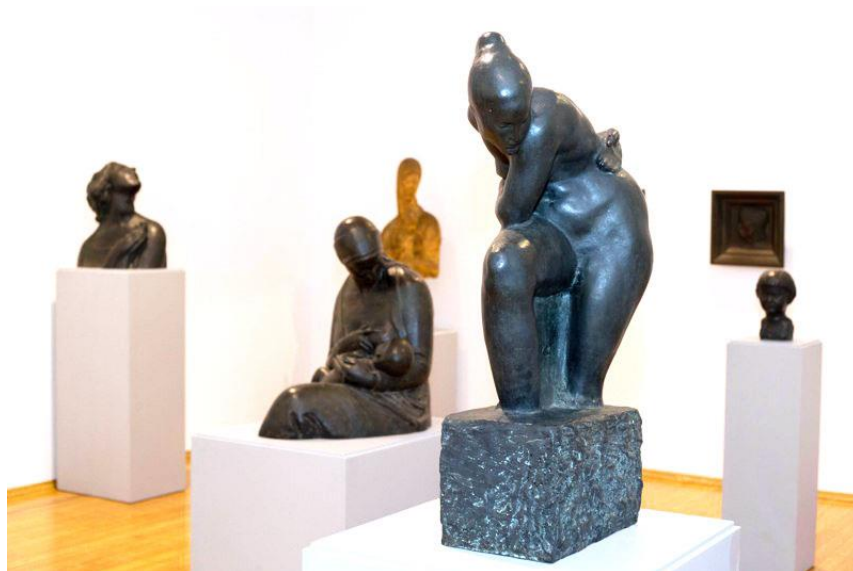
Slika 14. Skulpture