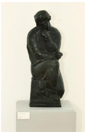
Slika10. Evangelist Luka

Ispod ovog teksta su prikazana izložena djela koja su stalni postav u galeriji, svako djelo je klasificirano po godini pristizanja u galeriju i načinu odljevanja, odnosno radi li se o gipsu ili bronci. Kao što je prethodno navedeno u radu skulpture se nalaze na postoljima na kojima se nalaze legende s nazivom i ostalim informacijama o djelu. Ranija djela velikog kipara su oblikovana u duhu secesije, a motivi tog ciklusa nastaju oživljavanjem nacionalnog mita kao i iz ljubavi prema domovini. Pred 1914. godinu umjetnik napušta epsku stilizaciju te sve više izražava emotivna stanja čemu mogu posvjedočiti reljefi biblijske tematike. U razdoblju od 1920. do 1930.-ih stvara klasična djela mramornih ženskih aktova te je napravio velik broj javnih spomenika. U njegovim portretima postiže psihologizaciju fizionomije, a svoj kiparski talent iznosi u dramskoj ekspresiji ljudskog tijela. 9 Kroz njegova djela se prožimaju motivi majke, a isklesao je skulpture koje prikazuju njegovu obitelj.