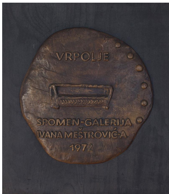
Slika 9. Radauš medalja revers