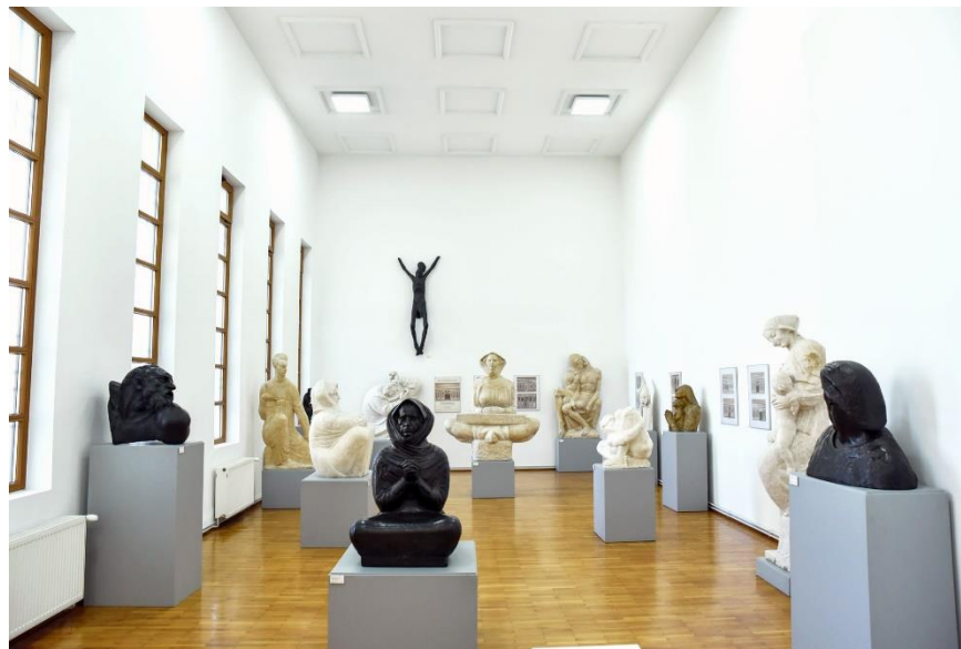
Slika 16. Djela nakon restauracije