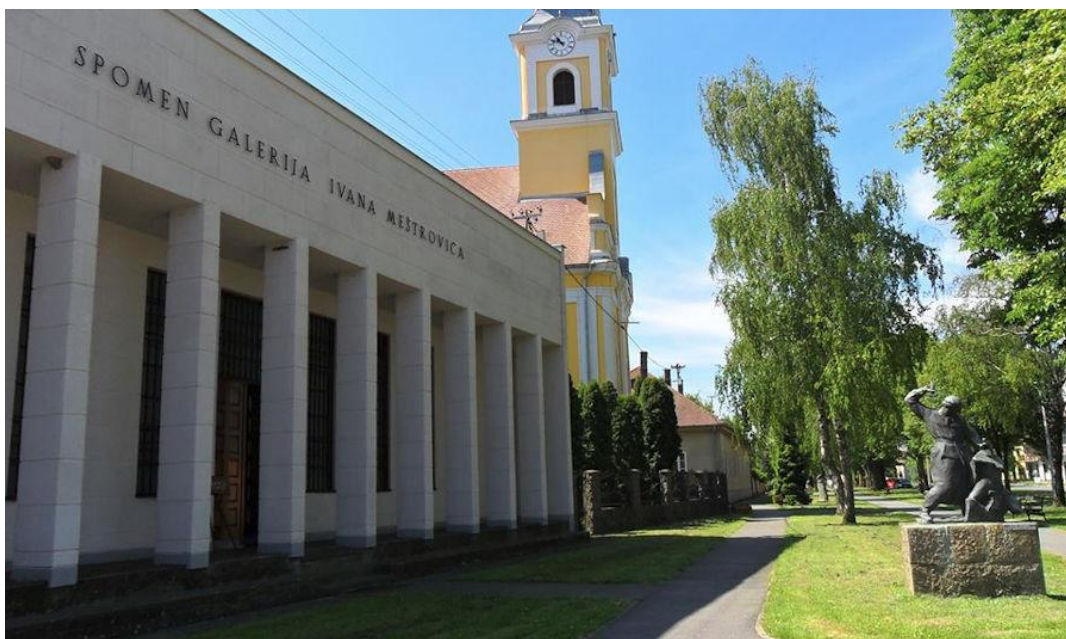
Slika 5. Spomen galerija i župna crkva

U stalnom postavu Spomen galerije izloženo je 35 Meštrovićevih radova, skulptura i reljefa u gipsu i bronci. Dvanaest radova je na posudbi iz fonda Atelijera Meštrović i dva iz Gliptoteke Hrvatske akademije znanosti i umjetnosti, a u Vrpolju su od otvorenja Spomen galerije. Ustanova ima dvije zbirke: Zbirka radova Ivana Meštrovića i Likovna zbirka, a u nastajanju je Zbirka dječjeg stvaralaštva. 6 Jedna od značajnijih osoba čijom zaslugom je fond Galerije porastao za nekoliko brončanih skulptura je kći Ivana Meštrovića gospođa Marija Meštrović. Ona je bila čest i drag gost u Galeriji. Meštrovićeve skulpture nalaze se i van Galerije pa je tako Marija dvije skulpture dozvolila odliti za tada novootvorenu osnovnu školu u Vrpolju koja nosi ime njenog oca. Riječ je o Konjiču i Autoportretu koji se još i danas nalaze u školi. U župnoj crkvi Rođenja sv. Ivana Krstitelja 1974. postavljena je Meštrovićeva skulptura Sv. Ivan Krstitelj . 7 Spomen galerija je smještena s desne strane Župne crkve Rođenja Sv. Ivana Krstitelja.