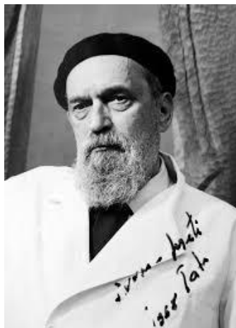
Slika 1. Fotografija Ivana Meštrovića

Ivan Meštrović rođen je od oca Mate Meštrovića i majke Marte Meštrović iz loze Gabrilovića 15. Kolovoza 1883. godine u Vrpolju. Kršten je u Župnoj crkvi Rođenja sv. Ivana Krstitelja 16. kolovoza 1883. Meštrovićevo rođenje u Vrpolju nije slučajnost. Njegovi roditelji su mjesecima prije njegova rođenja došli iz Otavica u Slavoniju kako bi zaradili za život. Tim događajem Vrpolje postaje mjestom rođenja ovog velikana, a nakon godinu dana od Ivanova rođenja obitelj Meštrović uputila se nazad u rodno mjesto u Dalmatinskoj zagori. Ivanovu nadarenost zamjetili su mnogi učeni ljudi još u njegovoj ranijoj dobi, međutim dječak nije imao uvjete za pohađati školu. Prve poticaje za izradu skulptura je dobio od svoga oca te je radio po uzoru na njegov zidarski, klesarski i tesarski rad. Meštrović je prvenstveno zapažen zbog svojih prvih radova vjerske tematike, a tako je postajao sve prepoznatljiviji u društvu. Kasnije uz mecenat Nikole Adžije odlazi na stručnu obuku u Split, a potom se odlazi školovati u Beč. Ondje se 1907. godine vjenčao s Ružom Klein. Nakon velikih uspjeha i priznanja u Europi, osvojio je i svjetsku scenu te se sa suprugom seli u SAD. Osim po vrhunskim kiparskim, likovnim i arhitektskim djelima, Meštrović je ostao poznat i kao autor više književnih djela. Život je skončao 16. siječnja 1962. u South Bendu. 1