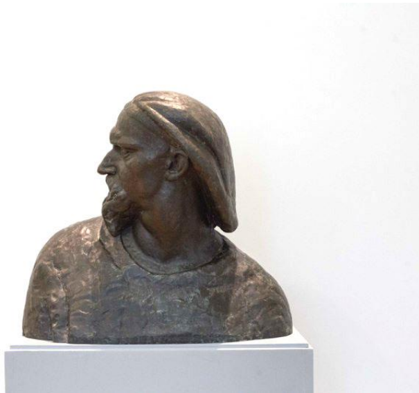
Slika 13. Autoportret