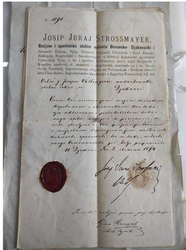
Slika 3. Pismo Josipa Jurja Strossmayera