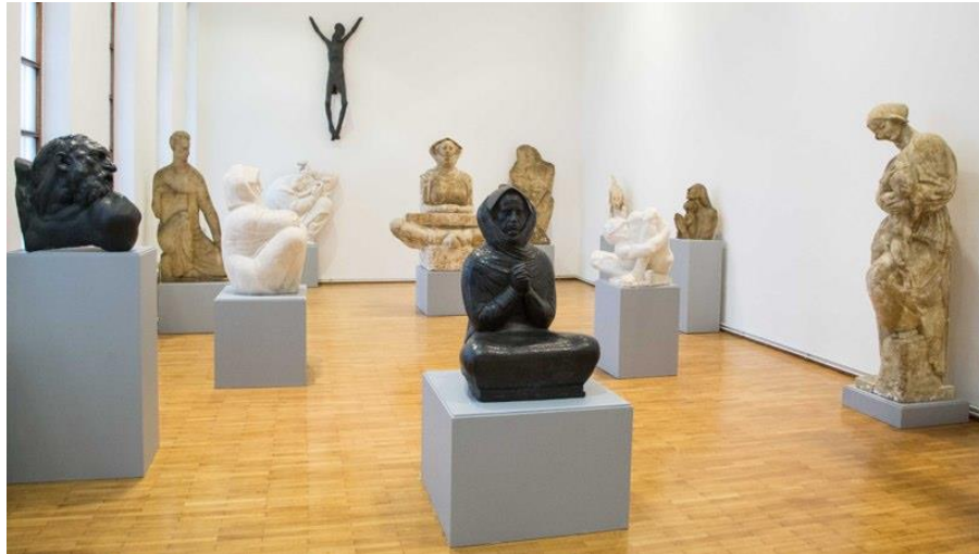
Slika 15. Djela prije restauracije