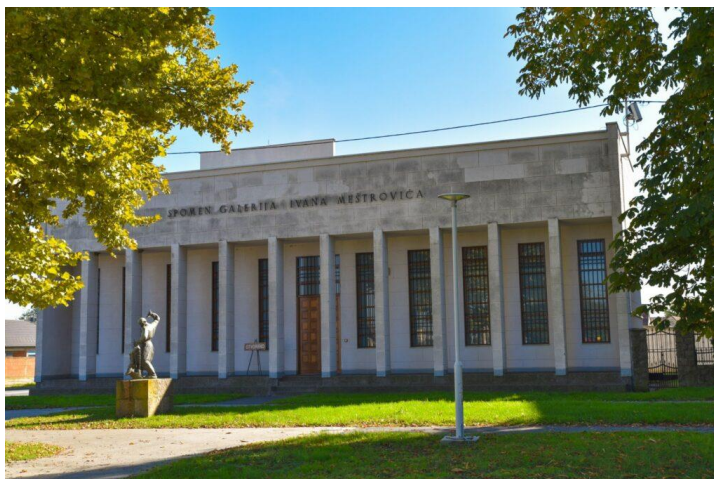
Slika 2. Spomen galerija Ivana Meštrovića

Povijest Spomen galerije Ivana Meštrovića vezana je uz osnutak kulturno-umjetničkog društva i muzeja „Ivan Meštrović” 1957. godine, Ovo društvo osnovala je grupa vrpoljačkih intelektualaca koje je predvodio učitelj Josip Gol. Galerija je prvotno zamišljena kao spomen-dom u kojemu će se slaviti djelo najvećeg hrvatskog i svjetskog kipara 20. stoljeća. Društvo je odmah kontaktiralo kipara u SAD-u i uputilo ga u svoje namjere, te je Ivan Meštrović za buduću galeriju darovao odljev u gipsu, Majčina briga / Majka i dijete (Beč, 1904., gips). Društvo je nakon smrti velikog kipara nakratko prestalo s radom, a 1967. ponovno kreće s radom, ali pod novim nazivom Kulturno društvo „Ivan Meštrović”. Gradnja Galerije počela je u kolovozu 1969. godine i financirana je od strane tadašnje općine Slavonski brod uz potporna sredstva republičkog fonda za kulturu i Mjesne zajednice Vrpolje. Spomen galerija Ivana Meštrovića svečano je otvorena 3. lipnja 1972. godine. Na otvorenju su bila izložena 22 posuđena djela u gipsu te dva u bronci u vlasništvu Galerije. Do 1989. godine Spomen galerija odljeva sedamnaest djela, a jedno otkupljuje (stvaranje vlastitog fonda). Za to su bile potrebne dozvole Meštrovićevih nasljednika ujedno i nositelja autorskih prava (supruga Olga i kći Marija). Registracija Galerije kao ustanove u kulturi obavljena je 1996. godine. 2