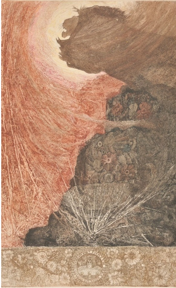
Slika 10.: Josip Leović, Božanska iskra, 1915.