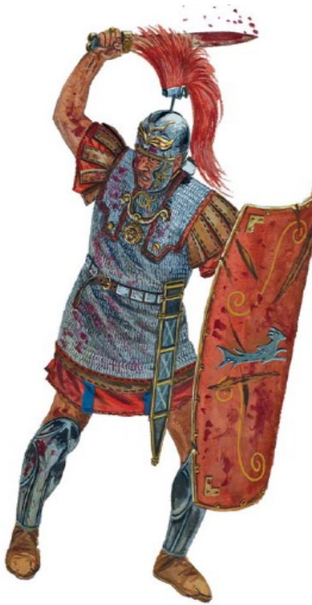
Prilog 6. Prikaz centuriona iz 1.st.poslije Kr.