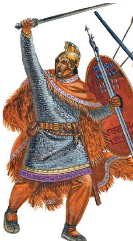
Prilog 8. Prikaz centuriona (centenarius) iz sred. 4. st.