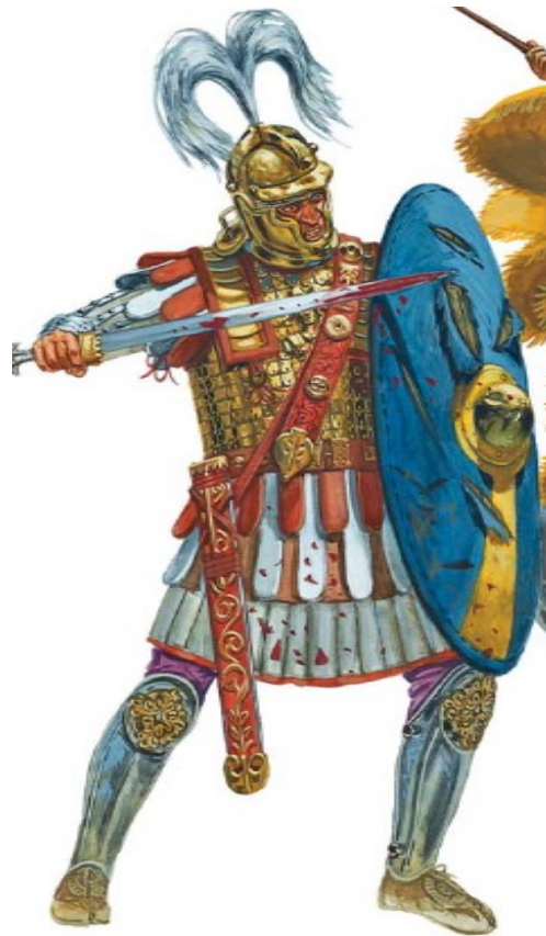
Prilog 7. Prikaz centuriona iz razdoblja Krize trećeg stoljeća