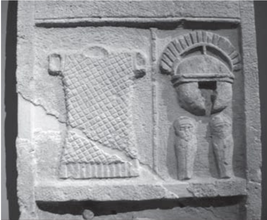
Prilog 4. Nadgrobni spomenik centuriona Tita Kalidusa Severa

ovom smjeru je centurion Lucilius, nadimka Cedo Alteram (lat. daj drugi) 25 . Lucilius je često lomio štapove disciplinirajući legionare te je bio prvi ubijen pri pobuni legionara. Kako su centurioni morali bitiiskusni administratori, isto tako su morali bitiiskusni časnici, jer je o njima ovisila centurija a nekad i cijela kohorta. Zbog ovih razloga su centurioni morali biti prepoznatljivi na bojištu, a brojni nadgrobni spomenici nam pokazuju i kako.