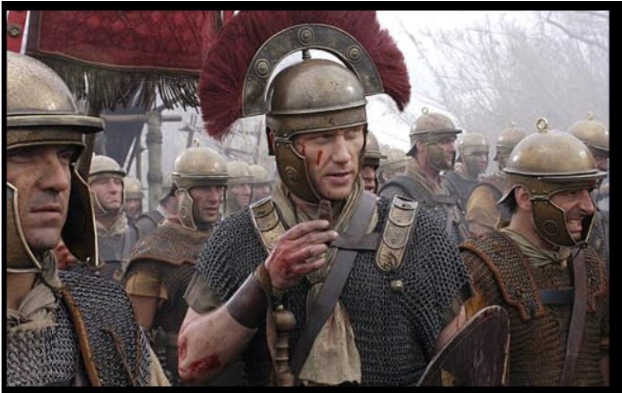
Prilog 5. Prikaz iz BBC-ove serije Rim

prikazan je i signifer s prepoznatljivom kacigom u obliku vuka, iako su signifer imali normalne kacige s krznima medvjeda ili lavova. Slika prikazuje dio bitke za Aleziju, a zanimljiv je prikaz borbe centurije. Vorenus pomoću zviždaljke daje znak za promjenu prvog reda, dok legionari drže legionara ispred sebe za oklop kako bi se održala uređenost postrojbe. Iako je ovakva pretpostavka zanimljiva, za nju nema potvrde u izvorima, te centurija vjerojatno nije imala ovakav stil borbe a centurion nije imao zviždaljku kojom je davao naredbe.