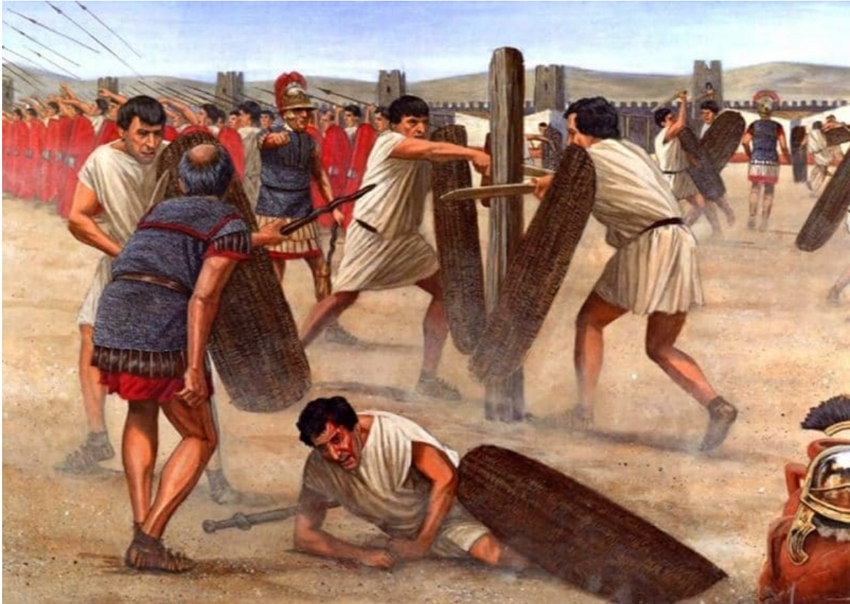
Prilog 3. Trening legionara

uče kako sačuvati vrste i prate svoj bojni znak u brojnim komešanjima,...“ (Vegecije,146.) U ovom citatu vidimo važnost uvježbanosti legionara unutar kohorti ali i unutar centurija, te važnost pozicija signifer i aquilifer . Vegecije isto tako opisuje razne vježbe s oružjem koje bilo u arsenalu legionara, a sve ove vježbe nadgleda i vodi centurion.