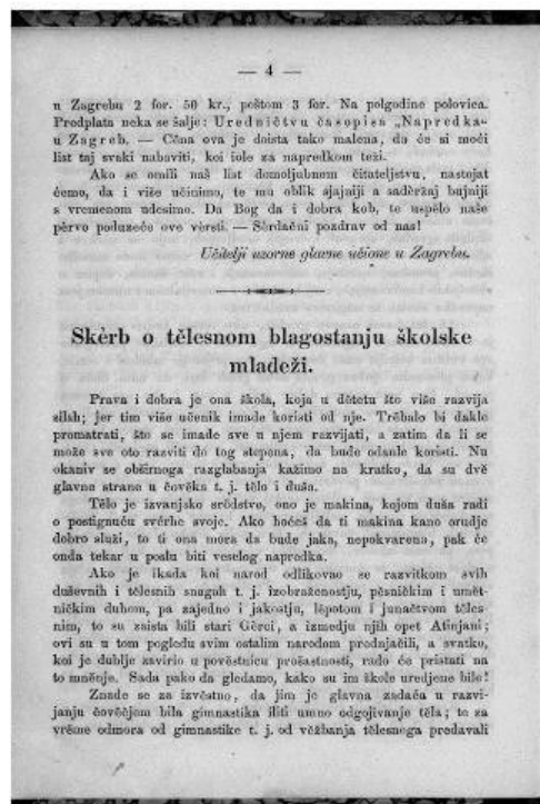
Slika 1. Učitelji uzorne glavne učione u Zagrebu. Program. // Napredak 1, 1 (1859.), str. 1-4.