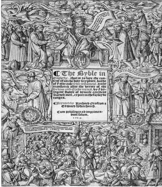
Slika 3. Naslovna stranica prve Biblije prevedene na engleski jezik 1539. g. – alegorijski prikaz Henrika kao novog vrhovnog autoriteta Crkve u Engleskoj

podjela počela se zamjenjivati individualnim religijskim pitanjem koji se istaknuo kao iznimno složen, uvjetovan djelovanjem državnih činovnika i pokoravanjem pojedinaca. Stoga se radilo o važnom problemu s kojim su se Henrik VIII. i Anglikanska Crkva morali suočiti, koje će trajati do kraja 16. stoljeća. 36