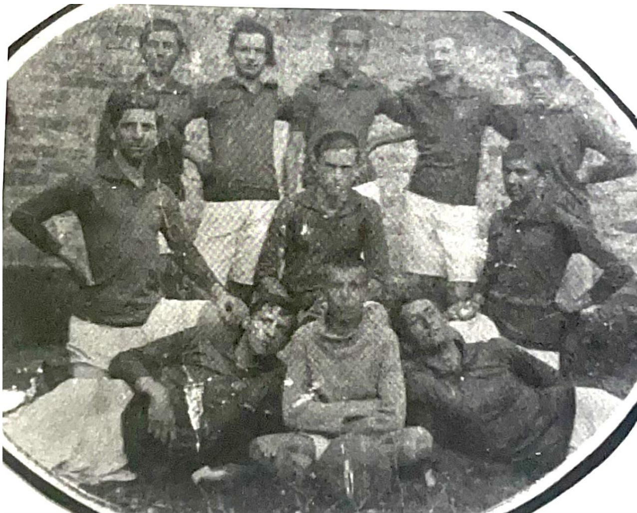
Prilog 4: Fotografija momčadi Slavije s prve utakmice, 17. rujna 1916.