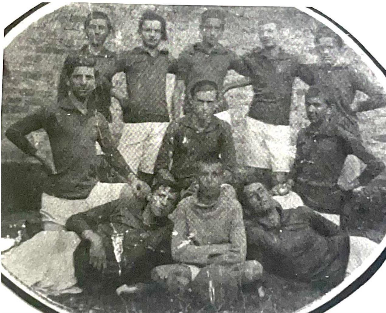
Prilog 4: Fotografija momčadi Slavije s prve utakmice, 17. rujna 1916.