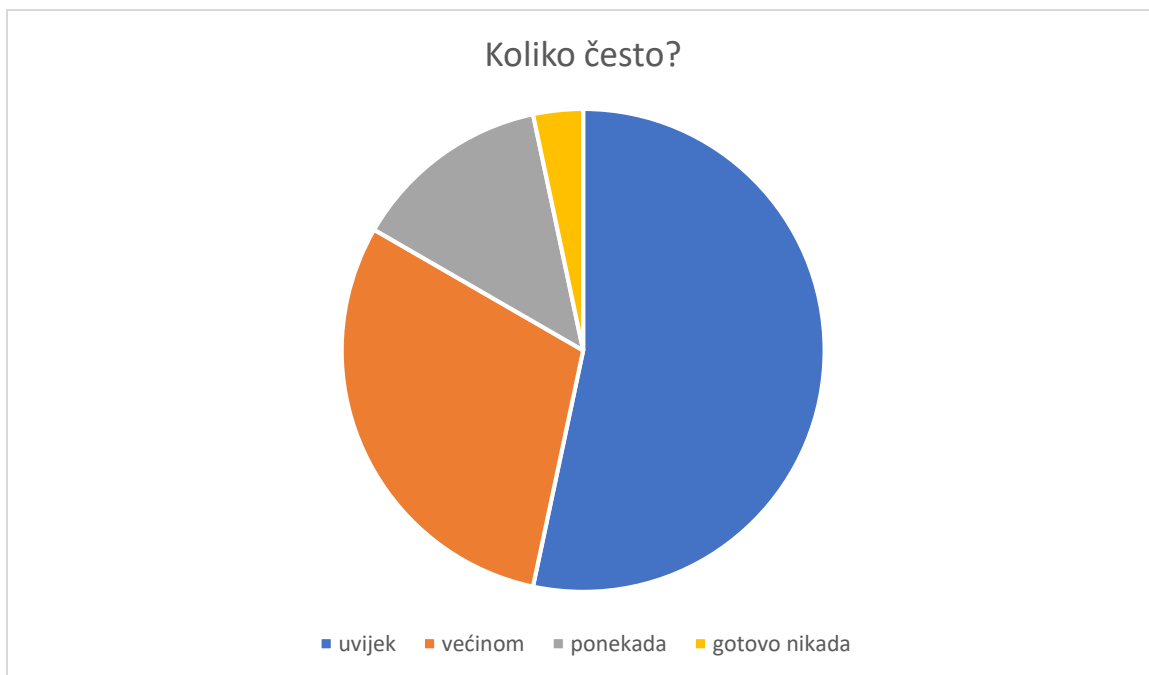
Slika 2 Grafički prikaz provedenog anketnog pitanja 2

Metodologija je bazirana na anketi u obliku upitnika sastavljenom preko Google Forms alata, koji je mailom upućen nastavnicima te su ga anonimno popunili. U anketnim upitnicima prema osnovnom obliku razlikujemo pitanja zatvorenog i otvorenog tipa. Pitanja zatvorenog tipa su pitanja s ponuđenim odgovorima nabiranja kao i pitanja s ponuđenim odgovorima intenziteta najčešće u obliku ljestvica. U anketnom upitniku korištena su oba tipa. Upitnik zatvorenog tipa kao instrument mjerenja korišten je iz razloga jer ga je lakše interpretirati, a samim time i analizirati. Prednosti ovakve metode su svestrana mogućnost primjene i relativna brzina prikupljanja podataka ispitivanjem.