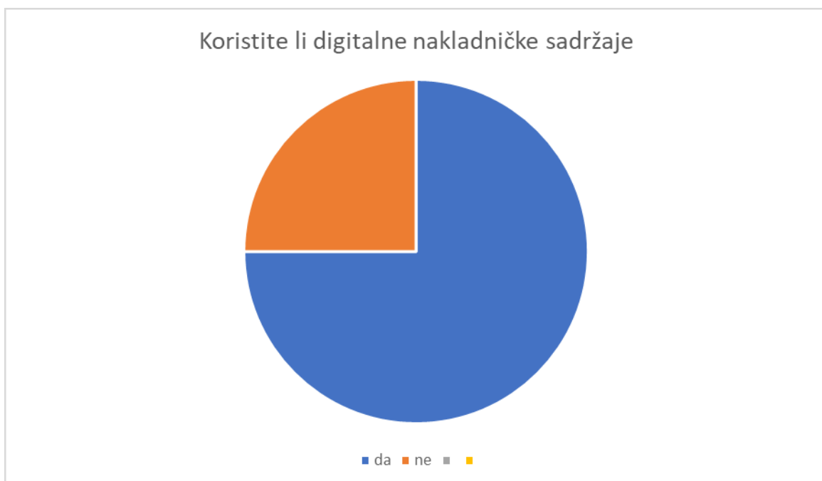
Slika 1 Grafički prikaz provedenog anketnog pitanja 1

Uzorkovanje koje je odabrano u istraživanju je jednostavan slučajni uzorak, koji je odabran zbog anonimnosti te zaštite podataka. Točnije, mogli bi ga nazvati klaster jednostavnim slučajnim uzorkom, jer je kao klaster odabrana skupina nastavnika.