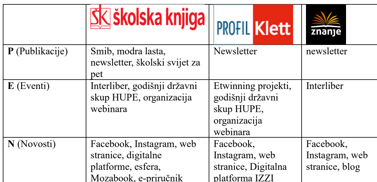
Tablica 1 Prikaz Kotlerova alata PENCILS na nakladničkim kućama

Odnosi s javnošću dio su promocije unutar marketinškoga miksa, a prema Kotleru MPR se sastoji od nekoliko alata koje možemo klasificirati pod akronimom PENCILS, kao što je ranije u radu i navedeno. Kotlerov alat primijenjen na nakladničkim kućama prikazan je u tablici 1.