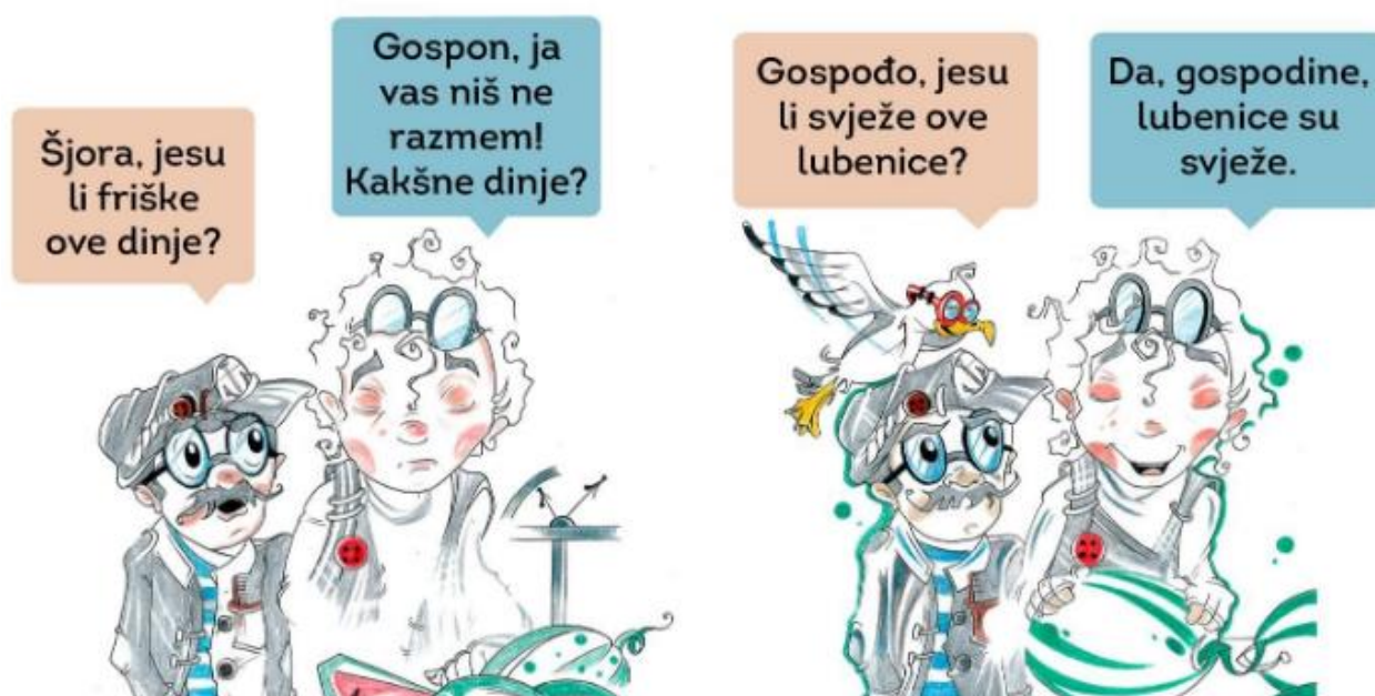
Slika 3. Crtež kao primjer lingvometodičkoga predložka u nastavi Hrvatskoga jezika

Crtež se može rabiti kao polazni, vježbeni i kao provjerbeni lingvometodički predložak. Kreativnost je u nastavi vrlo važna i nužna.