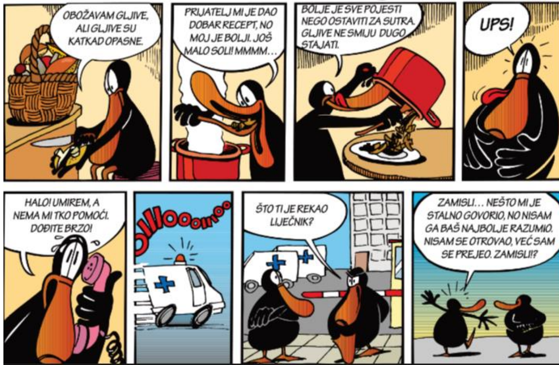
Slika 1. Strip kao primjer lingvometodičkoga predložka u nastavi Hrvatskoga jezika i komunikacije

Vježbeni tekst može biti i strip. Na ovome je primjeru moguća vježba nezavisnosloženih rečenica, primjerice suprotnih rečenica. Nakon što učenici pročitaju strip, moraju pronaći sve veznike u stripu ( a, ali, nego, no, već ). Učenici mogu odrediti odnose među surečenicama i navesti veznike koje povezuju surečenice. Učenici mogu primijetiti i da se kod suprotnih rečenica zarez gotovo uvijek piše, ali i da postoji iznimka kod veznika nego ( Bolje je sve pojesti nego ostaviti za sutra ), ako se koristi nakon rečenice u kojoj je atribut u komparativu. Vježbom na primjeru stripa učenici mogu sami izvesti određenu definiciju suprotnih rečenica. Učenici radom na stripu kao vježbenom tekstu mogu jasno opisati suprotne rečenice. Uz pomoć suprotnih veznika mogu prepoznati i pisati suprotne rečenice. Također, učenici mogu razlikovati suprotne od rastavnih i sastavnih rečenica i usporediti njihove razlike i sličnosti.