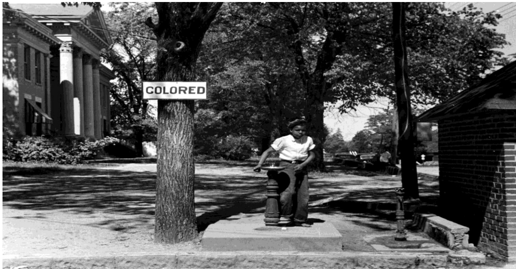
Slika 3 – Prikaz odvojenih fontana za vodu kao posljedica Jim Crowa

dom te je postignut dogovor između Demokrata i Republikanaca, poznat i kao „Kompromis 1877“. Dvadeset spornih elektorskih glasova su dani Rutherfordu B. Hayesu, republikanskom kandidatu, koji je onda obećao povući vojsku s Juga i službeno završiti Rekonstrukciju. Ponovno slanje vojske na Jug spriječeno je sa Posse Comitatus zakonom koji je zabranio korištenje federalne vojske u provođenju unutarnje politike. 43 Rekonstrukciju su Republikanci napustili da bi ostali na vlasti, ali isto tako treba shvatiti to da vjerojatno ništa nisu mogli više ni napraviti jer su gubili na popularnosti. Kraj Rekonstrukcije i povlačenje vojske s Juga značilo je da sada ništa nije spriječavalo Demokrate da pokušaju vratiti stvari kakve su bile prije rata. Kako bi još više osigurali svoju moć su stvorili Jim Crow zakone, koji su imali zadaću potpuno segregirati Jug. Ranije spomenuti testovi pismenosti i porezi na glasanje su prošireni kako bi se što više Afroamerikancima otežalo glasanje te ih zapravo odgovoriti od ikakvog sudjelovanja u političkom životu što će Demokratima osigurati prevlast u tim savezним državama jedno cijelo stoljeće. 44