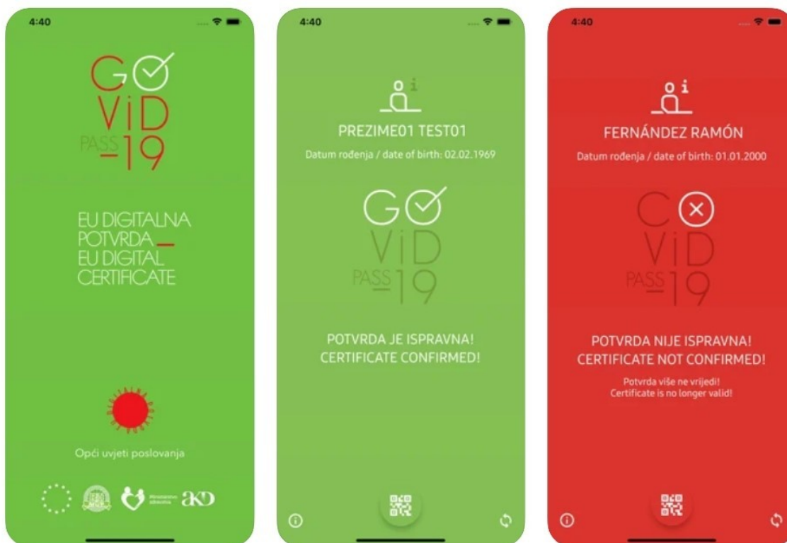
Slika 4, primjer iz aplikacije CovidGO 37