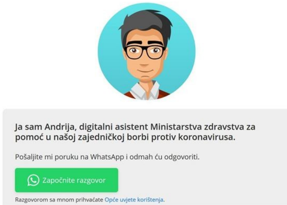
Slika 3. digitalni osobni asistent Andrija 35

Aplikacija CovidGO služi za provjeru EU digitalnih potvrda. Aplikacija radi na principu validacije putem QR koda na EU digitalnim COVID potvrđama izdanim u Republici Hrvatskoj i državama članicama EU. Putem aplikacije moguće je provjeriti valjanost potvrda o testiranju, cijepljenju i preboljenju koronavirusa. Aplikacija CovidGO ne obrađuje osobne podatke nego isključivo provjerava nacionalni digitalni potpis zapisan u QR kodu. U slučaju valjane potvrde ekran će se prikazati u zelenoj boji, a u slučaju da potvrda nije valjana prikazat će se crveni ekran s dodatnim obrazloženjem. 36