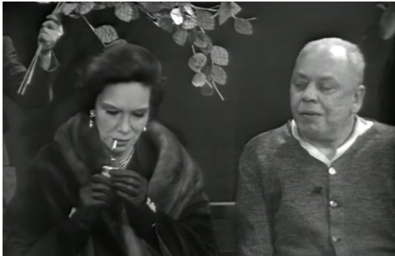
Der Besuch der alten Dame (1959, 00:27:40)

Weitere Betrachtung verdient der Einsatz der Worte Baum und Ast. Dürrenmatt wollte wahrscheinlich anmerken, dass es in der Szene eine untergeordnete Person gibt, die Ill darstellt. Deshalb nutzt er das Hyponym Äste und das dazugehörige Hyperonym Baum.