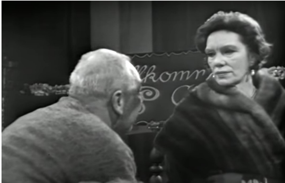
Der Besuch der alten Dame (1959, 00:44:50)

Claires dominante Körperhaltung und ihr Gesichtsausdruck verleihen dieser Szene eine besondere Wichtigkeit, weil sie in den vorangegangenen Gesprächen gegenüber Ill noch nicht übergeordnet war.