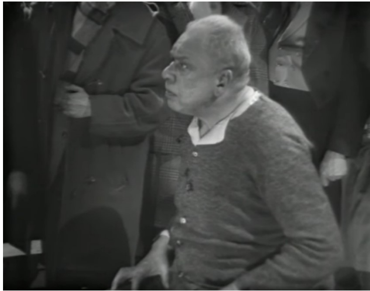
Der Besuch der alten Dame (1959, 01:46:33)