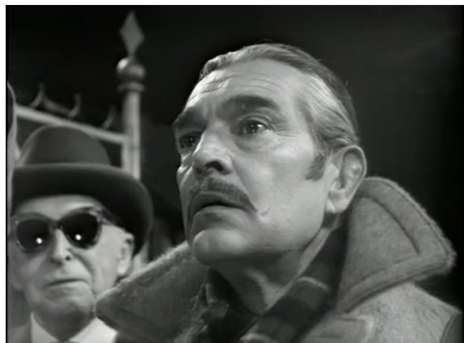
Der Besuch der alten Dame (1959, 00:14:40)