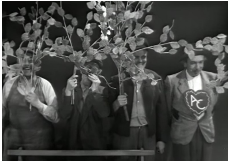
Der Besuch der alten Dame (1959, 00:25:30)