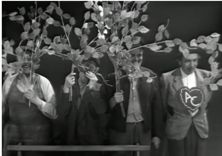
Der Besuch der alten Dame (1959, 00:25:30)