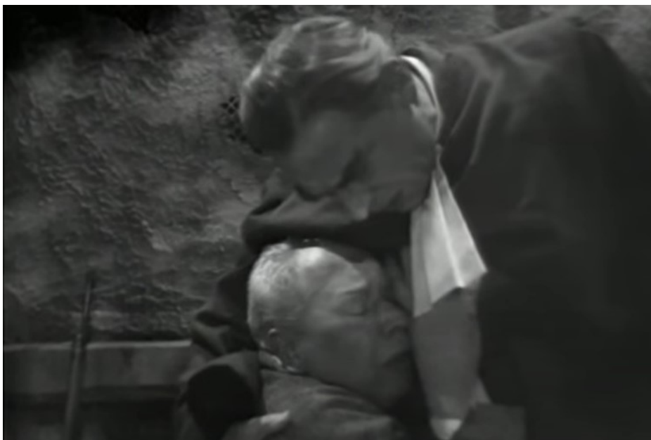
Der Besuch der alten Dame (1959, 01:08:42)

Betrachtet man das obige Bild, erkennt man, dass Ill, der in diesem Fall das „Opfer“ darstellt, beleuchtet ist, während der Pfarrer im Schatten steht. Obwohl Folgendes nicht eine direkte Voraussetzung dieser Arbeit ist, erinnert das obige Bild an die ein Jahr ältere Verfilmung von Terence Fishers Dracula aus dem Jahr 1958 (Bild unten).