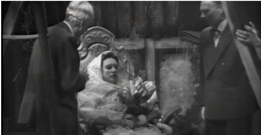
Der Besuch der alten Dame (1959, 01:15:13)

Der Schatten auf dem Gesicht, die Protagonistin in einer Sänfte, in Weiß gekleidet mit Blumen in den Händen: Diese Konstellation lässt im Zuschauer Spannung und Furcht aufkommen und vermittelt ein Gefühl von der Erhabenheit der Claire Zachanassian. Beil Neuhaus und Kühnel (2016: 41) definieren die Wirkung von Oberlicht. Es kann bei extremem Einsatz auch auf Objekte so wirken, dass es eine Tiefe und einen Druck auf das gefilmte Objekt ausübt. Im obigen Bild von Claire ist ein leichtes Oberlicht zu erkennen. Interessant ist der Einsatz von low-key Beleuchtung, mit der die Dominanz durch dunklere Töne unterstrichen wird. Das entspricht auch Claires Charakter.