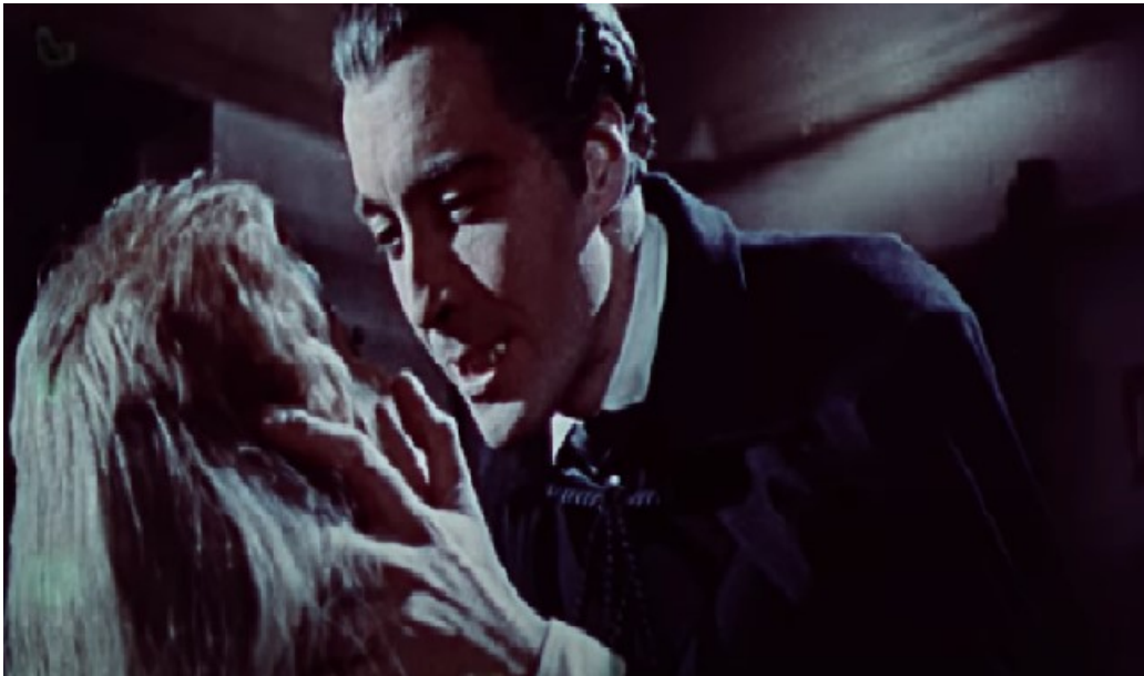
Terence Fisher, Dracula (1958)

Der Vergleich von den beiden Bildern kann möglicherweise mit einer Aussage des Pfarrers in Verbindung gebracht werden. Er nannte die Güllener auch Heiden, die vom christlichen Weg abgewichen seien. Sie seien schwach und erlügen den Versuchungen, die ihnen in Form von materiellem Wohlstand geboten würden.