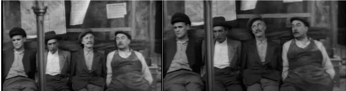
Der Besuch der alten Dame (1959, 00:01:00)

Im oberen linken Bild sind die gezeigten Bürger von Güllen heller angestrahlt worden, als in den nachfolgenden Sekunden, wie es im Bild 2 (rechts) zu sehen ist. Mit Unterbrechungen in der Beleuchtung wurde somit ein Zug simuliert. Diese Szene bzw. dieser Zug ist für den Spannungsbogen insofern wichtig, da angedeutet wird, Züge seien von Bedeutung. Dementsprechend weckt die Szene Erwartungen in Bezug auf die weitere Handlung am Bahnhof.