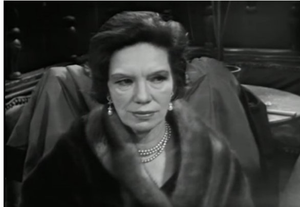
Der Besuch der alten Dame (1959, 00:36:19)

Ziel einer Nahaufnahme ist es, die Mimik der Figur ganz besonders in den Fokus zu rücken. Das hat den Effekt, dass Gefühle und Atmosphäre besonders zur Geltung kommen. Ähnlich, jedoch noch etwas näher an der Figur selbst, ist die sogenannte große Einstellung. Sie hat unter anderem die Aufgabe, Spannung zu erzeugen und die Aufmerksamkeit auf das Geschehen zu lenken. Im Folgenden ein Beispiel aus der Verfilmung: