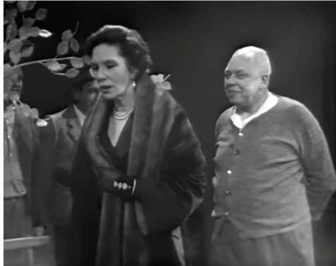
Der Besuch der alten Dame (1959, 00:26:29)