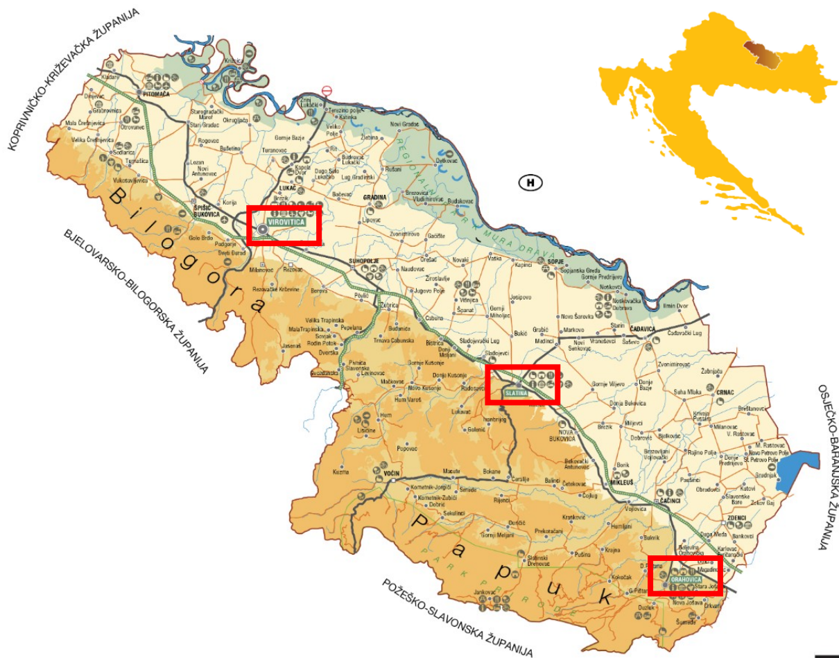
Prilog 1. Karta Virovitičko-podavske županije.

Gradovi Virovitica, Slatina 1 i Orahovica danas administrativno pripadaju Virovitičko-podravskoj županiji, koja se nalazi u kontinentalnom dijelu Republike Hrvatske te je mjesto dodira središnje i istočne Hrvatske, odnosno, županija je poveznica Slavonije s Podravinom i središnjom Hrvatskom. Županija ima izduženi oblik u obliku pravca istok-zapad, a sama je županija topografski podijeljena na sjeverni, nizinski prostor uz rijeku Dravu te južni, brdsko-planinski prostor koji obuhvaća sjeverne padine Bilogore, Papuka i Krndije. 2