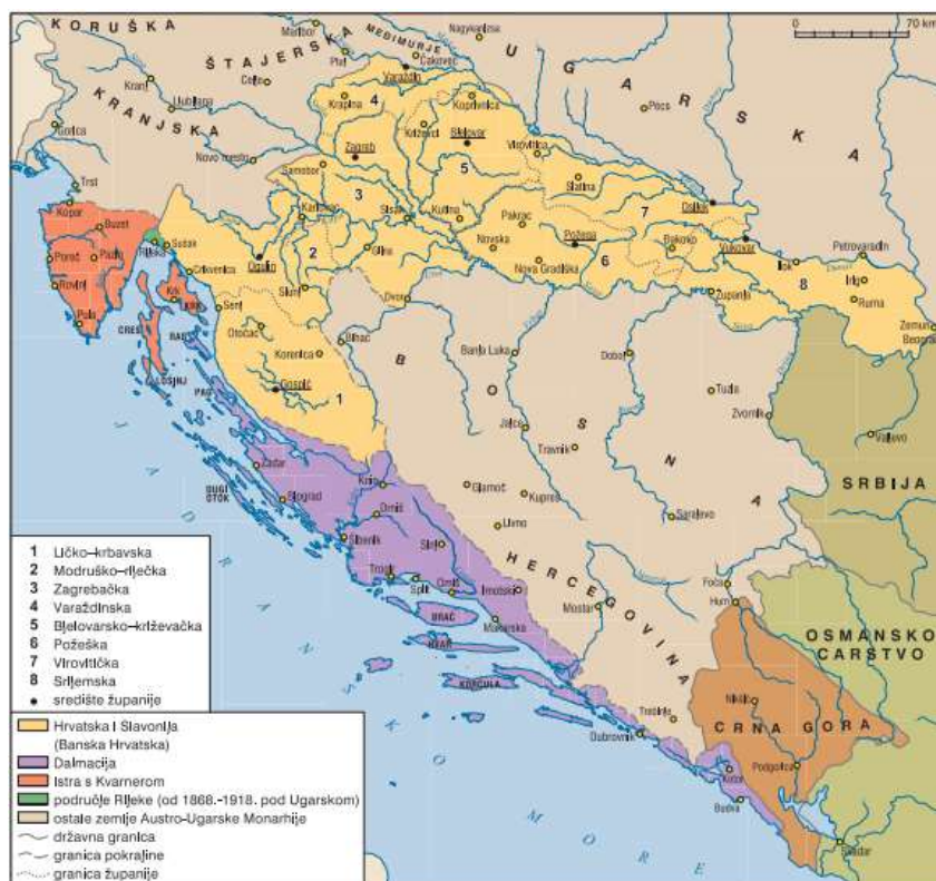
Prilog 1. Hrvatske zemlje i županije krajem 19. stoljeća 15

Opis priloga 1: Slika prikazuje hrvatske zemlje krajem 19. stoljeća skupa sa županijama. Hrvatske zemlje tada su činile: Banska Hrvatska (Hrvatska i Slavonija, istočna granica u Zemu u današnjoj Republici Srbiji, zapadna granica kod Rijeke u današnjem Kvarneru, sjeverna granica kod današnjeg grada Varaždina i južna granica na području današnjeg mjesta Gračaca) i Dalmacija (sjeverna granica kod mjesta Gračac, na jugu do Boke kotorske i istočno uz planinu Dinaru gdje je i današnja granica sa Bosnom i Hercegovinom). Istra s Kvarnerom također je pripadala Hrvatskoj, ali je sve do polovice 19. stoljeća bila pod austrijskom vlašću kada se 1822. pripaja Trojednoj Kraljevini. Područje grada Rijeke pripadalo je Ugarskoj sve do 1918. godine.