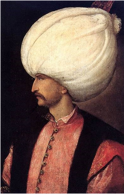
Prilog 1. Sultan Sulejman I. Veličanstveni