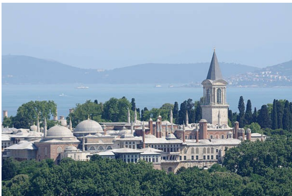
Prilog 3. Vanjski izgled palače Topkapı