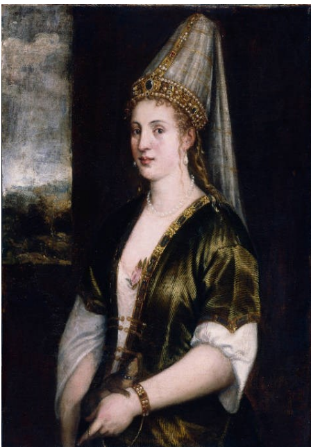
Prilog 2. Sultanija Hürrem