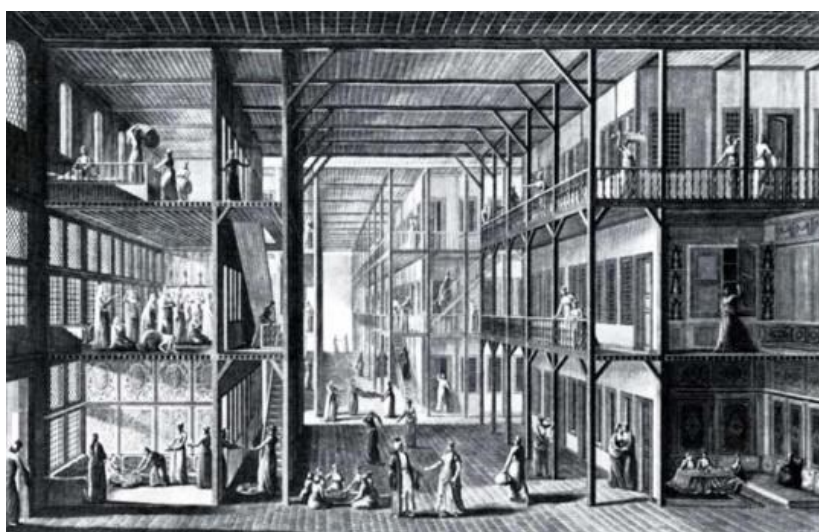
Prilog 4. Unutrašnji izgled harema