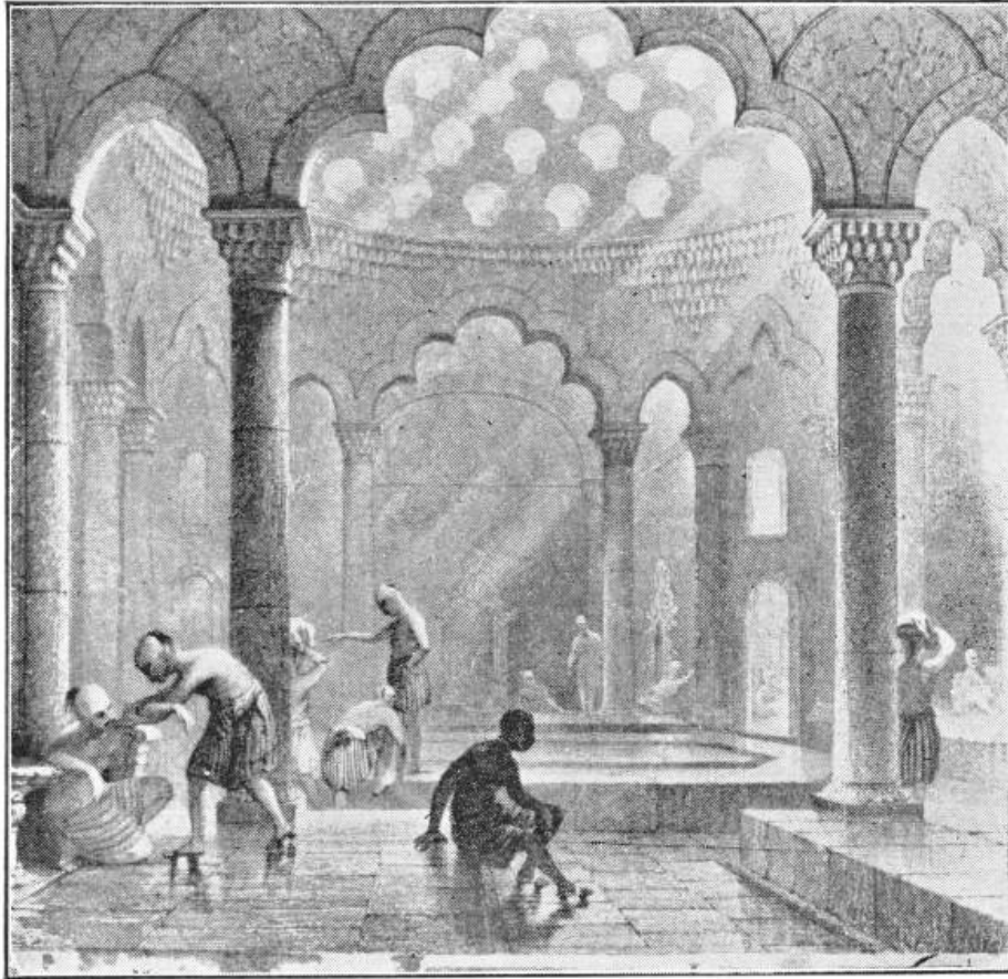
Prilog 5. Prikaz unutrašnjosti hamama